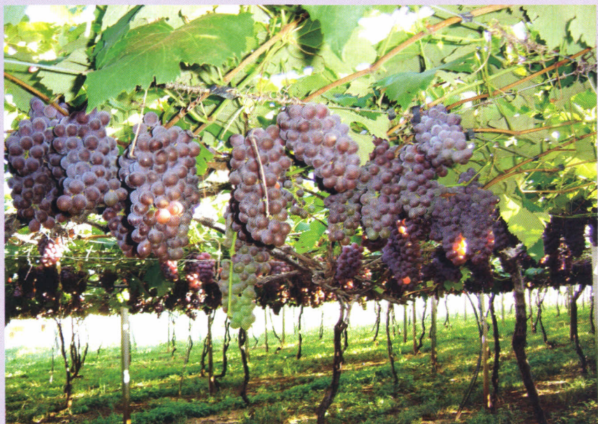
Loiva de Melo

No que se refere a uvas passas, houve aumento de 1,31% na quantidade importada e redução de 8,03% no valor, no ano de 2012. Praticamente toda a uva-passa consumida no país é importada.