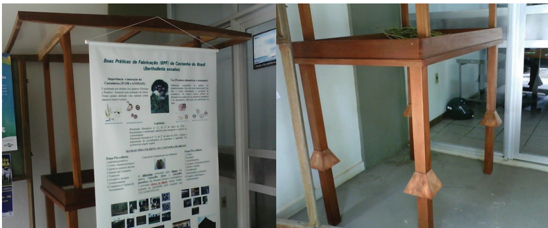
Figura 4. Mesa de secagem demonstrativa, na sede da Embrapa Roraima.

Uma pequena quantidade de castanha é destinada ao consumo nas comunidades na forma de beiju, paçoca, leite, mingau e doce. O hábito de comer as amêndoas com farinha de mandioca também é comum entre os indígenas.