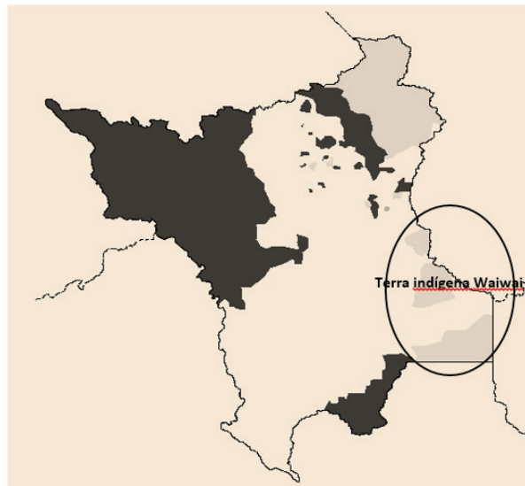
Figura 2. Terras indígenas no estado de Roraima e localização da área de estudo.

As terras indígenas são demarcadas pela FUNAI (Fundação Nacional do Índio) e ocupam cerca de 11,6% do território nacional, com uma área de 991.498 km 2 (FUNAI,2011). Em Roraima as terras indígenas ocupam uma área de 103.221 km 2 o que corresponde a 46,16% da área territorial do Estado (Figura 2).