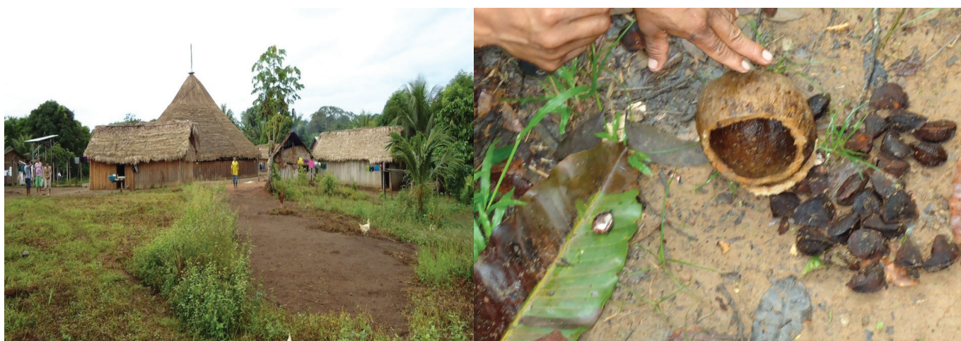
Figura 1. Comunidade Indígena Anauá e fruto da castanha-do-brasil.

Neste sentido, este trabalho foi realizado com o objetivo de caracterizar o sistema extrativista e realizar uma estimativa dos custos de produção para a extração da castanha-do-brasil, praticada pelos índios Waiwai em Roraima na safra 2010/2011.