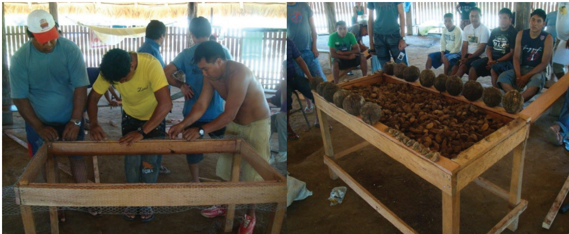
Figura 3. Construção de mesa de secagem em curso de capacitação em manejo e boas práticas da castanha.

O terceiro transporte que é realizado da comunidade até o ponto de venda ao atravessador, também é realizado via fluvial, através de canoas. O período de viagem varia de 3 a 10 horas, dependendo da localização da comunidade e do ponto de comercialização. Os indígenas comercializam suas castanhas com atravessadores dos estados do Pará, Acre e Amazonas, negociando a partir da melhor oferta. A lata de castanha ( \pm 12 kg) foi negociada a R$ 21,00 em 2010.