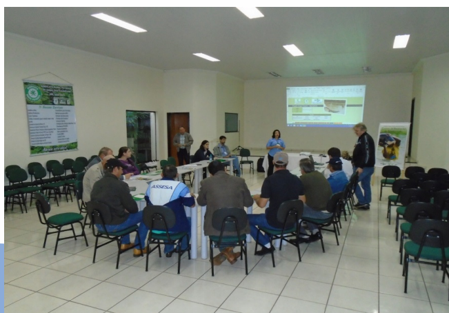
Painel Campo Futuro da Aquicultura em Assis Chateaubriand (PR).

A Embrapa Pesca e Aquicultura e a CNA agradecem o apoio da Federação de Agricultura do Paraná – FAEP e do sindicato rural de Assis Chateaubriand na realização e organização do painel, bem como a colaboração dos produtores e técnicos presentes no levantamento das informações.