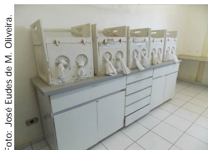
Figura 5. Criação do parasitoide ( Coccidoxenoides perminutus ) confinado em gaiolas mantidas em sala climatizada.

Na sala de criação do parasitoide, as abóboras com ninfas do segundo instar devem ser acondicionadas em gaiolas de madeira (50 cm x 45 cm x 50 cm – largura, comprimento e altura), com face superior de vidro, faces laterais com tela de náilon de malha fina e face frontal coberta por tecido do tipo voile (Figura 5).