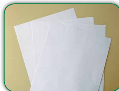
Folhas de papel ofício