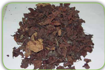
Folhas secas de leguminosas