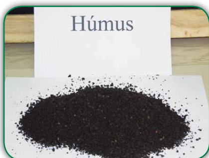
Húmus (proveniente do minhocário)