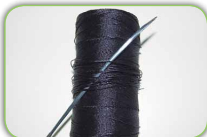
Agulha de crochê e fio de nylon