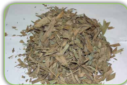
Folhas secas de bambu