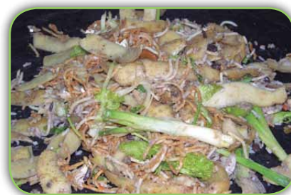
Restos vegetais de comida