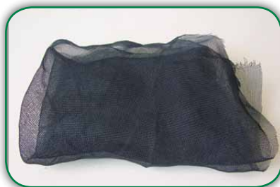
Sombrite ou tela