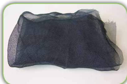
Sombrite ou qualquer tipo de tela