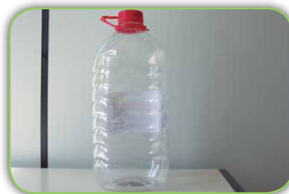
Garrafa pet de 5 litros