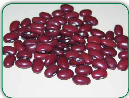
Sementes de feijão