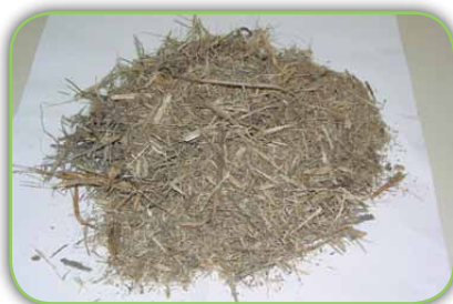
Bagaço de cana seco