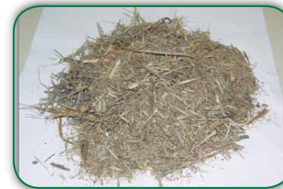
Ou bagaço de cana seco