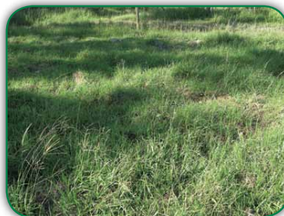
Área de gramado