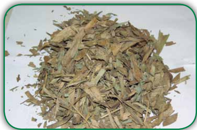
Folhas secas de bambu