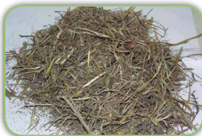
Folhas secas de capim