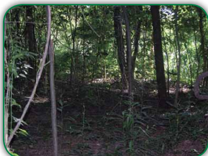
Área de mata