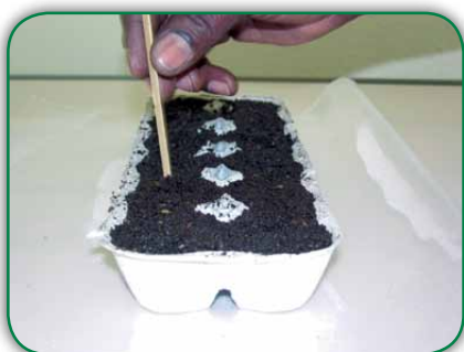
Palitos de churrasco