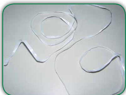
Pedaços longos de fita