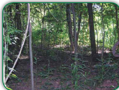
Área de mata