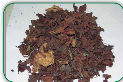
Folhas secas de leguminosas