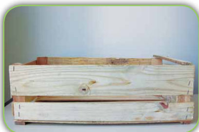
Caixote de feira