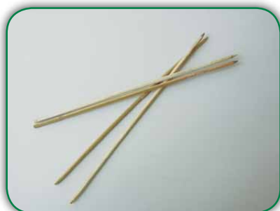
Palitos de churrasco