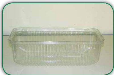
Descartável de torta