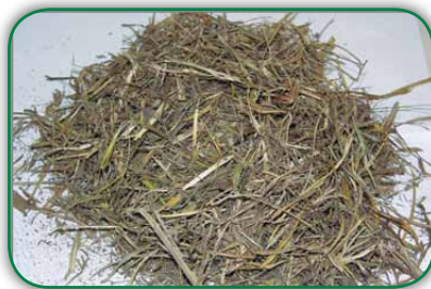
Folhas secas de capim