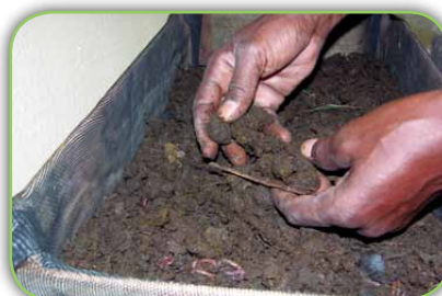
Esterco (bovino) curtido*