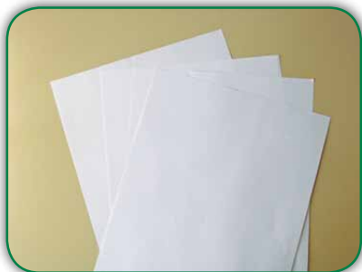
Folhas de papel ofício