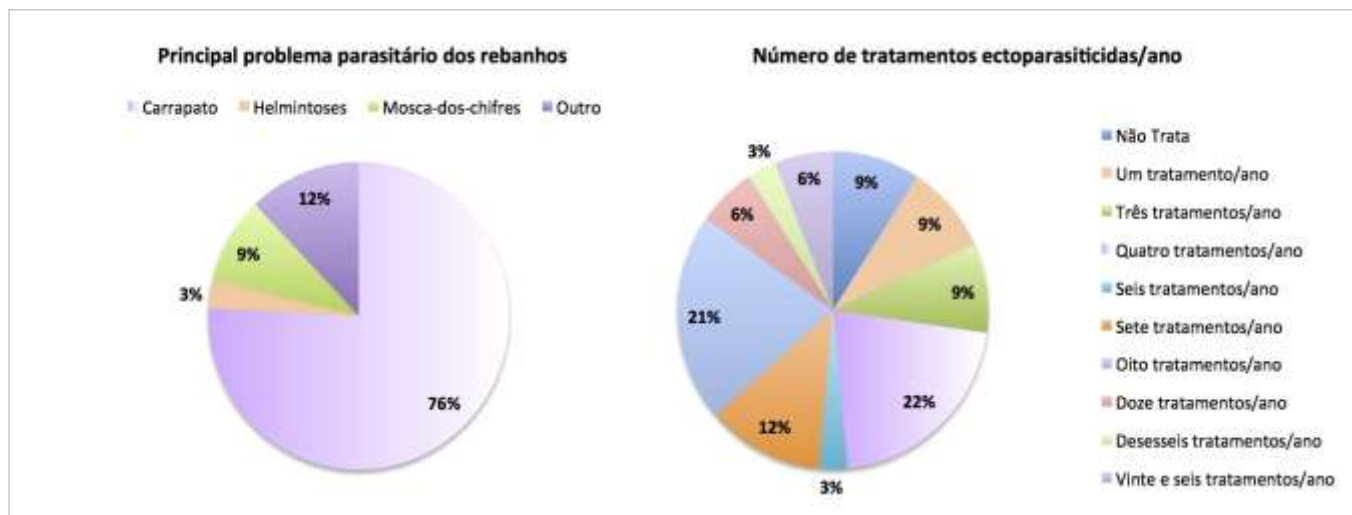
Figura 1. Percepção dos pecuaristas em relação ao principal problema parasitário em rebanhos bovinos e bubalinos em Rondônia.

O período de maior ocorrência de infestação pela mosca-dos-chifres, relatado para os rebanhos avaliados é de setembro a dezembro, o qual é coincidente com o período de maior precipitação pluviométrica em Rondônia (Tabela 1).