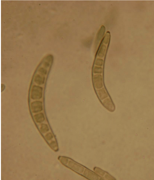
Figura 1. Conídios de Bipolaris maydis . Imagem obtida em microscópio ótico com aumento de 40x.

cilíndricas. Os ascósporos medem de 6-7 x 130-340 \mu\text{m} , apresentam coloração escura e possuem de 5 a 9 septos.