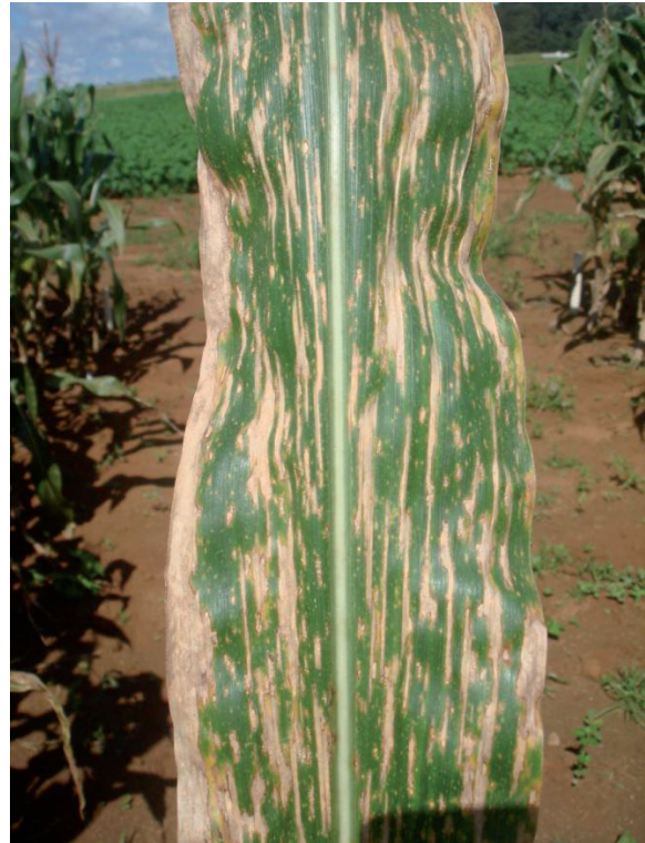
Figura 2. Sintomas da mancha-de-bipolaris em folha de milho.

caracterizados por lesões, estreitas, alongadas e necróticas.