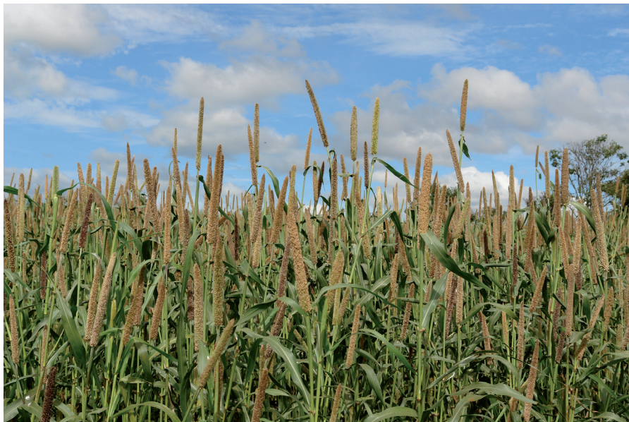
Figura 1. Ensaio com milheto.

No mundo, o número de insetos atacando o milheto é bastante extenso, sendo listados, por Sharma e Davies (1988), cerca de 458 espécies. Destacam-se a lagarta-do-cartucho, Spodoptera frugiperda (J. E. Smith, 1797) (Lepidoptera: Noctuidae), inseto de maior ocorrência nas lavouras e que causa maior desfolha na planta podendo levá-la à morte. O ataque dessa espécie é predominantemente no cartucho da planta; contudo, se a infestação ocorrer na fase inicial do cultivo, as lagartas perfuram a base da planta, atingindo o ponto de crescimento, reduzindo muito o estande. Assim, em plantios feitos após culturas hospedeiras dessa praga o potencial destrutivo pode ser ainda maior.