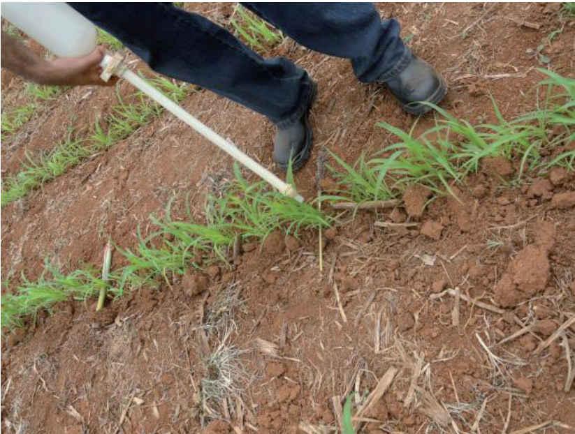
Figura 4. Infestação no campo com auxílio de Bazuca

Foram realizadas três infestações de lagartas recém-eclodidas de S. frugiperda obtidas de criação de manutenção de laboratório, feitas de forma sequencial semanal, que iniciaram 20 dias após o plantio. A infestação foi feita com auxílio de um dispositivo apropriado (bazuca) com bico dosador para aplicação nas respectivas plantas, com número variável de insetos por metro linear (Figura 4).