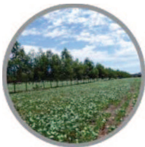
Cultivo de soja em plantio direto na palhada do capim entre fileiras simples de eucalipto (iLPP).