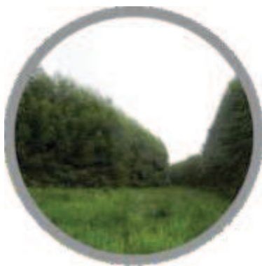
Sistema silvipastoril (ILP).