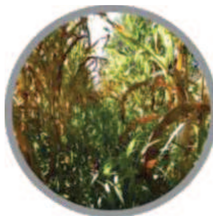
Milho em final de ciclo e crescimento do capim ( Brachiaria brizantha cv. Xaraés) em sistema agrissilvipastoril (iLPP) com linhas simples de eucalipto.