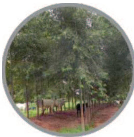
Sistema silvipastoril (ILP) em faixas com linhas triplas de eucalipto e pastagem com Brachiaria brizantha cv. BRS Piatã.