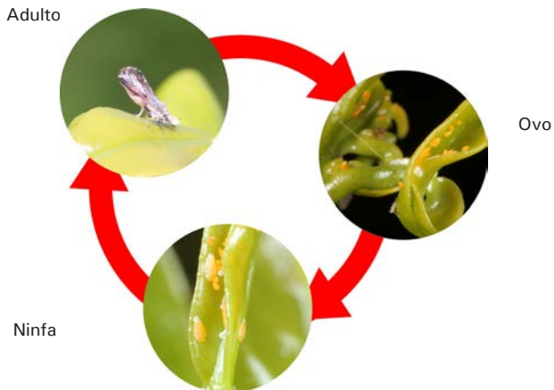
Figura 2. Fases do ciclo biológico de Diaphorina citri .

Fotos: Paulo Lanzetta. Montagem: Renata Abreu Serpa.