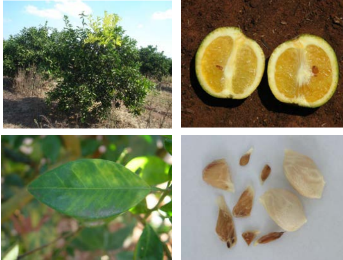
Figura 3. Sintomas do HLB nos citros. A) Planta com ramo com sintoma típico de HLB; B) Folha com mosqueamento; C) Fruto cortado ao meio, apresentando a casca e demais partes de forma assimétrica; D) Sementes de diversos tamanhos, sendo as menores abortadas.

Esta doença tem causado perdas totais na produção de citros, especialmente em países africanos e asiáticos (FRASER, 1978; MARTINEZ; WALLACE, 1967). É considerada a principal doença dos citros em várias regiões do mundo, sendo os seus sintomas dificilmente detectados, uma vez que sua distribuição não é uniforme, tanto na planta quanto no pomar (GRAÇA, 1991). É uma doença de difícil controle e, atualmente, a única forma de combatê-la é a detecção das plantas infectadas pelo patógeno e sua erradicação.