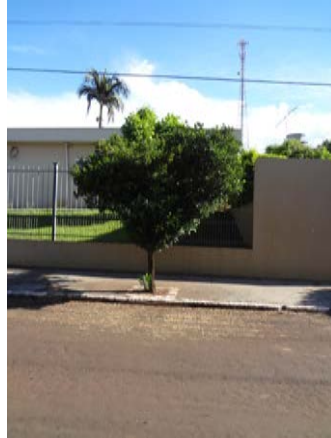
Figura 1. Planta de murta, hospedeira de Diaphorina citri .