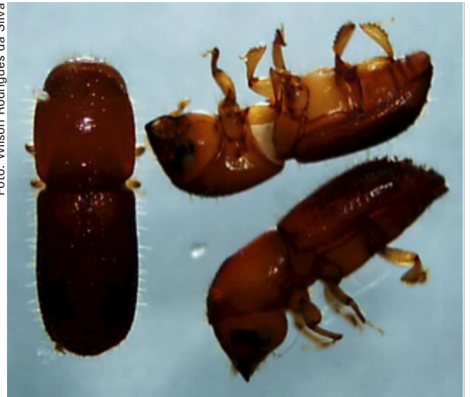
Figura 2. Broquinha-do-cupuaçu, Xyleborus affinis (Coleoptera: Scolytidae).

A família Scolytidae pertence à Ordem Coleoptera, composta por besouros muito pequenos, que causam sérios danos às essências florestais. A maioria das espécies ataca árvores em pé, ou recém cortadas, algumas atacam madeira beneficiada, outras são brocas de sementes. Tanto adultos como larvas são daninhos às plantas, algumas espécies alimen-