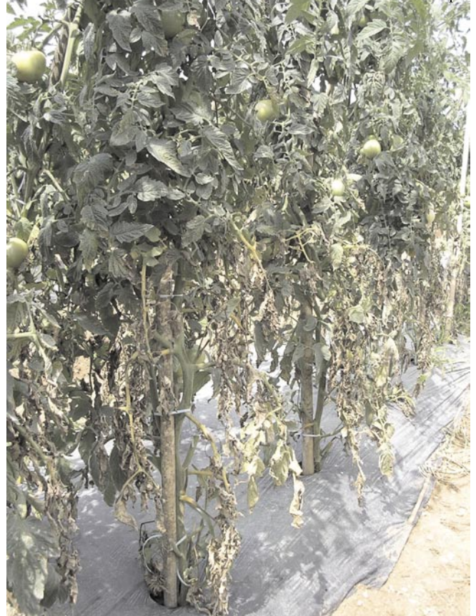
Fig. 2. Queima da saia de tomate estaqueado, causada por Septoria lycopersici .