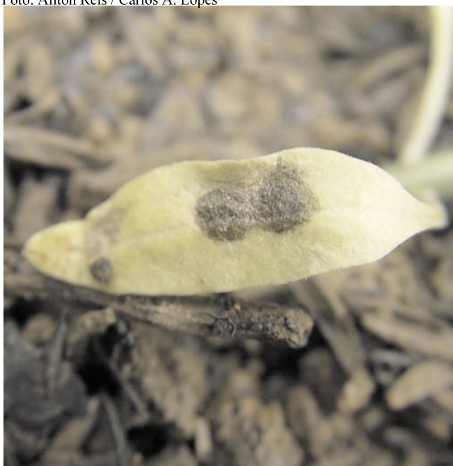
Fig. 5. Mancha-septória em cotilédone de tomateiro.