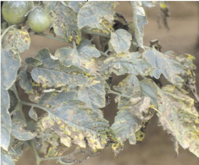
Fig. 1. Queima-de-septória em planta de tomate estaqueado.