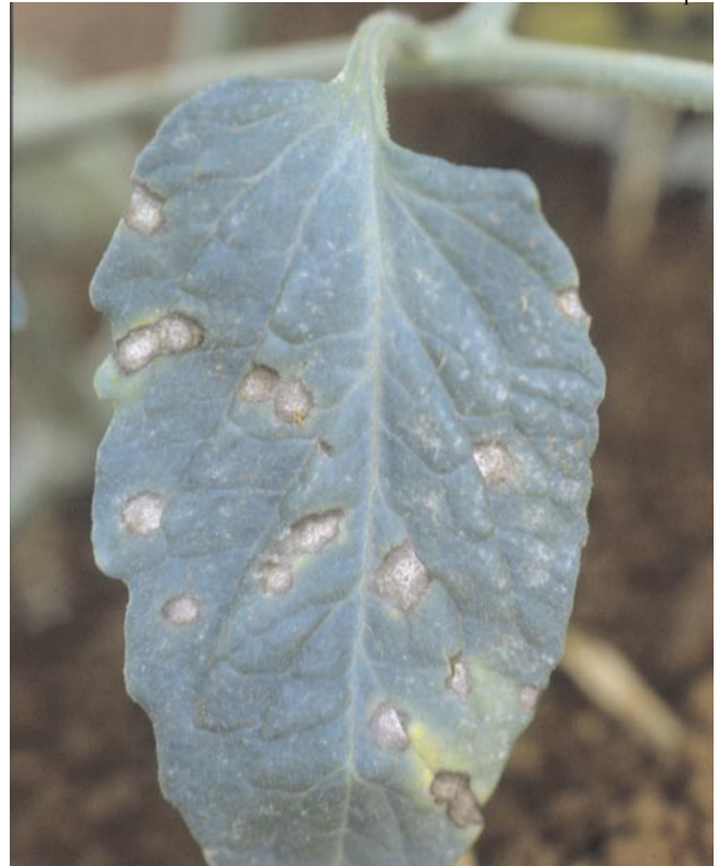
Fig. 3. Manchas típicas, causadas por Septoria lycopersici , em folíolo de tomate.