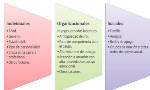
Figura 3. Variables que intervienen en el desarrollo del síndrome de agotamiento laboral