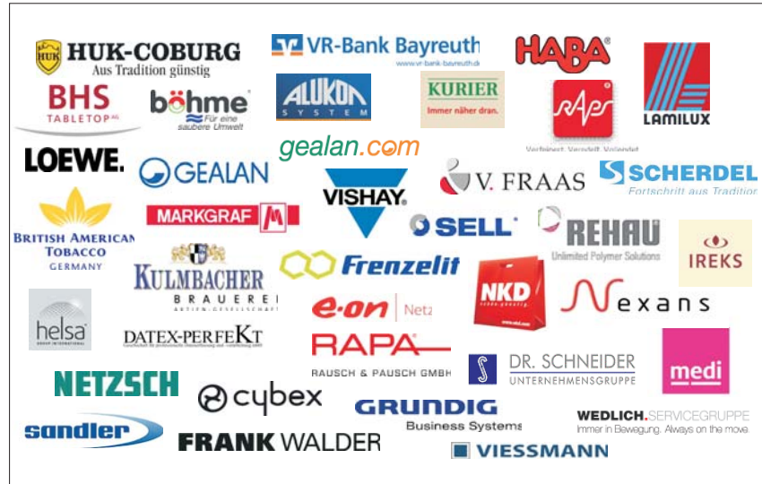
Aktuell 37 Mitglieder im PERSONET