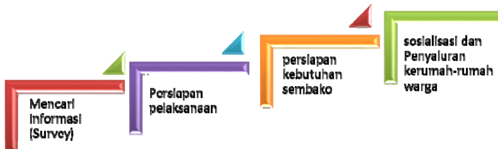
Gambar. 2. Tahapan Kegiatan PKM

Tahapan kegiatan PKM ini dapat dijelaskan melalui Gambar berikut ini :