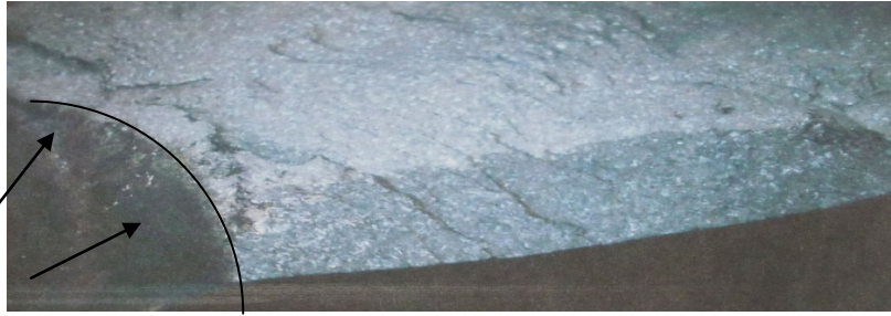
Gambar 2. Indikasi awal patah ditemukan pada bagian atas yaitu daerah yang tidak menerima benturan akan tetapi menerima beban bending saat bekerja.

Pada gambar 2 terlihat patahan pertama pada saat die mengalami kerusakan. Tanda panah menunjukkan arah terjadinya retakan awal yang mengakibatkan die menjadi pecah. Pada daerah ini juga diduga adanya material las yang membuat die tersebut mengalami keretakan awal hingga terjadi retak yang lebih parah sehingga mengakibatkan die pecah.