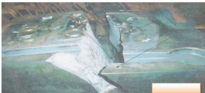
Gambar 1. Photo makro Dies under bracket mengalami retak pada bagian atas.

Penampilan dari permukaan arah patah mempunyai bentuk patah statik, hal ini dapat dilihat dari adanya sudut patah. Pada gambar 1 terlihat die yang mengalami kerusakan setelah produksi, dimana die tersebut pecah menjadi dua bagian. Kerusakan terjadi pada die bawah yang mana saat die mengalami kerusakan sekitar 5 jam setelah die beroperasi.