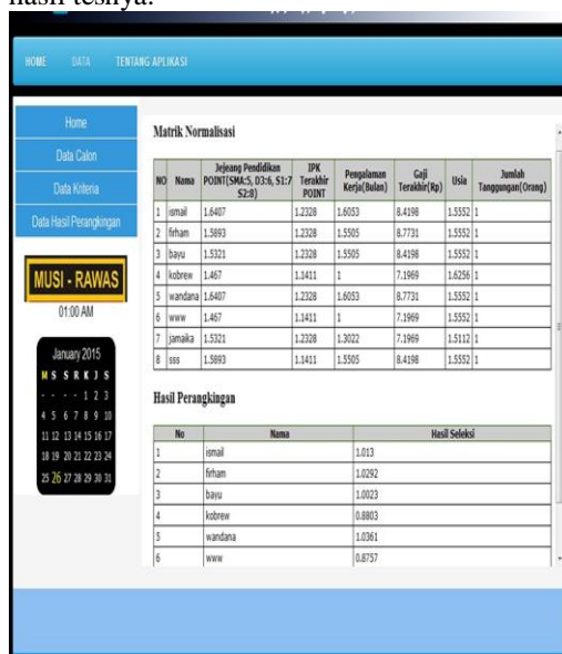
Gambar 3. Implementasi Menu User Hasil Perangkingan Atau Hasil Tes

Untuk menu hasil perangkingan atau hasil tes dapat dilihat pada Gambar 6 berikut. Pada menu ini user dapat melihat siapa saja yang diterima sebagai karyawan baru setelah user melakukan beberapa seleksi dan di dapat hasil tesnya.