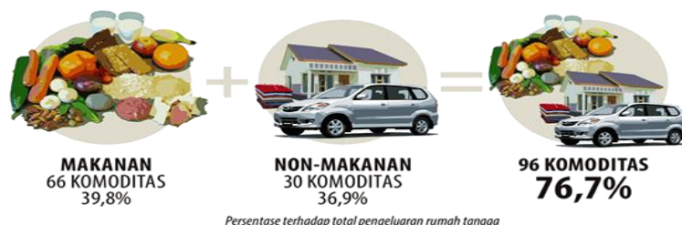
Gambar 2.10 Persentase Daya Beli

Pengertian daya beli masyarakat menurut Dr. Supawi pawengan adalah kemampuan masyarakat sebagai konsumen untuk membeli barang atau jasa yang dibutuhkan. Daya beli masyarakat ini ditandai dengan meningkat ataupun menurun, dimana daya beli meningkat jika lebih tinggi dibanding periode lalu sedangkan daya beli menurun ditandai dengan lebih tingginya kemampuan beli masyarakat dari pada periode sebelumnya. Penghitungan Paritas Daya Beli. Dihitung dari bundel komoditas makanan dan non makanan. Kegunaannya adalah menggambarkan tingkat kesejahteraan yang dinikmati oleh penduduk sebagai dampak semakin membaiknya ekonomi.