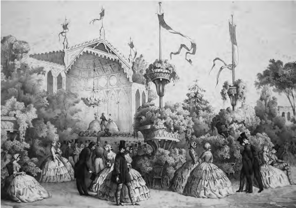
ABBILDUNG 6 UND 7 Sowohl der Bal Mabille als auch Le Château des Fleurs gehörten zu der Tanzlokal-Kette der Brüder Mabille, einem frühen Unternehmen der aufblühenden Pariser Freizeitbranche. Während der Bal Mabille zunächst Tanzschülern als Übungsparkett diente und später (nicht zuletzt aufgrund der prachtvollen Beleuchtung) zu einer der beliebtesten Tanzstätten von Paris avancierte, wandte sich Le Château des Fleurs zunehmend an ein flanierendes oder auch schlichtweg sitzendes Publikum, das sich von voluminösen Orchesterklängen berauschen ließ, ohne deshalb zwangsläufig das Tanzbein schwingen zu müssen.