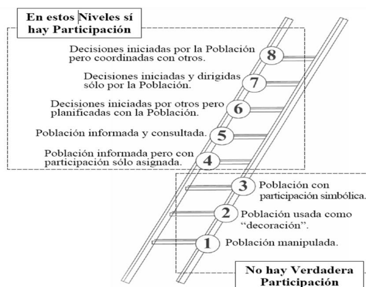
Figura 5: Escalera de la participación. Arnstein (1969)

Se puede ver que en este proyecto se intenta buscar la participación de las personas en todo el proceso desde el inicio hasta el final. Se pretende llegar al nivel de participación que plantea Arnstein (1969) con su escalera de la participación que a continuación se muestra: