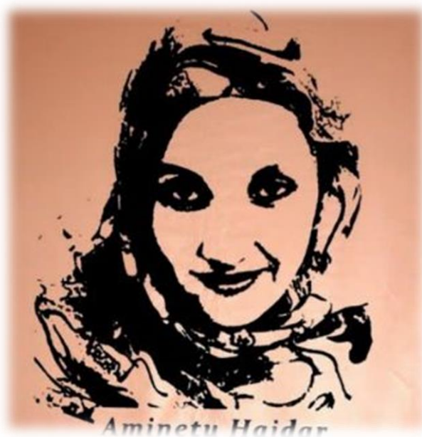
Figura 4: Aminetu Haidar activista saharauí

Aminetu Haidar, en 1987 quiso acercarse a una delegación de la ONU que visitaba El Aaiún y la policía marroquí la sorprendió con un montón de panfletos. Fue detenida y permaneció hasta 1991 en la cárcel negra de El Aaiún. Los tres primeros años, con los ojos vendados. En todo ese tiempo la dieron por desaparecida, ni su familia ni ninguna organización supieron nada de ella. Relata el horror con voz suave y tranquila y ha hecho de la resistencia pacífica el símbolo de la lucha de su pueblo. “Supe después que a muchos de los chicos que detuvieron conmigo les arrancaron las uñas; otros, murieron; a algunos les tuvieron varios días colgados y les azotaron” . En 2008 se le ha concedido el premio Robert F Kennedy de Derechos Humanos.