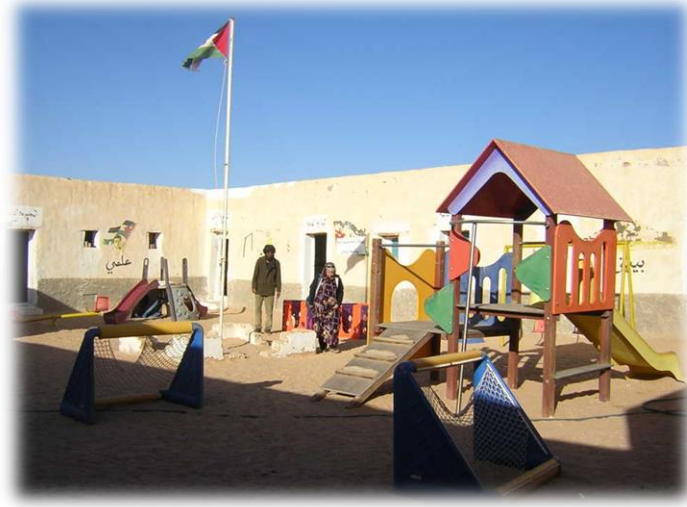
Figura 7: Parque infantil en la guardería de Smara.