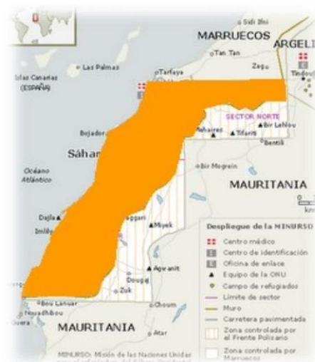
Figura 1: Zona ocupada del Sahara.

En cuanto al territorio ocupado destacar que está formado por una pequeña parte de población saharauí y por personas cuya nacionalidad son marroquíes y que fueron puestos allí como estrategia por el rey Hassan II por si se celebrara un referéndum. Además este territorio se encuentra protegido por un enorme ejército marroquí para prohibir la entrada o la salida desde esa zona ocupada a la liberada. En el siguiente mapa en color naranja podemos observar donde se localiza la zona ocupada.