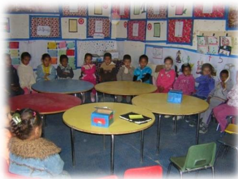
Figura 6: Interior de la guardería de Smara.

Este espacio se utiliza como guardería infantil para las y los más pequeños pero se podría usar a las tardes para poner en marcha el programa de “la ludoteca Noor”, se trata de un sitio que tiene pocos recursos pero es acogedor y grande para que los niños y niñas saharauis se diviertan y disfruten.