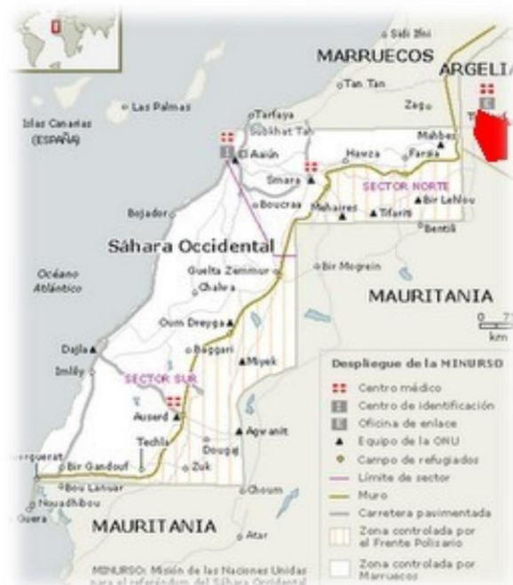
Figura 3: Campamentos de refugiados en Tinduf.

Cada Wilaya cuenta con un hospital regional, un centro de salud (dispensario) por cada Daira, una escuela regional, una guardería por Daira y un pequeño huerto.