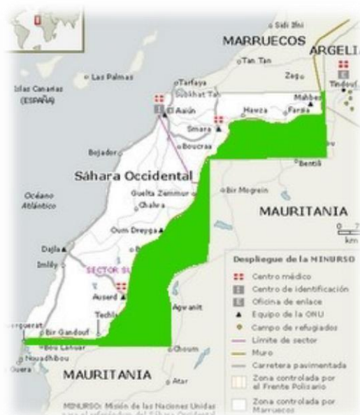
Figura 2: Zona liberada del Sahara.

Los territorios liberados están formados por la parte que va desde el Norte hasta el Sur entre la frontera de Mauritania y “el muro de la vergüenza” que separa el Sahara Occidental ocupado del liberado. Además, estos territorios fueron reconquistados por los saharauis en una lucha contra el ejército marroquí. Hoy en día se encuentran habitados por nómadas que se desplazan desde el campo de refugiados en busca de pasto para los animales y por el ejército de Liberación saharauí que, ante el riesgo de enfrentamientos, sigue desplegado en los Territorios Liberados.