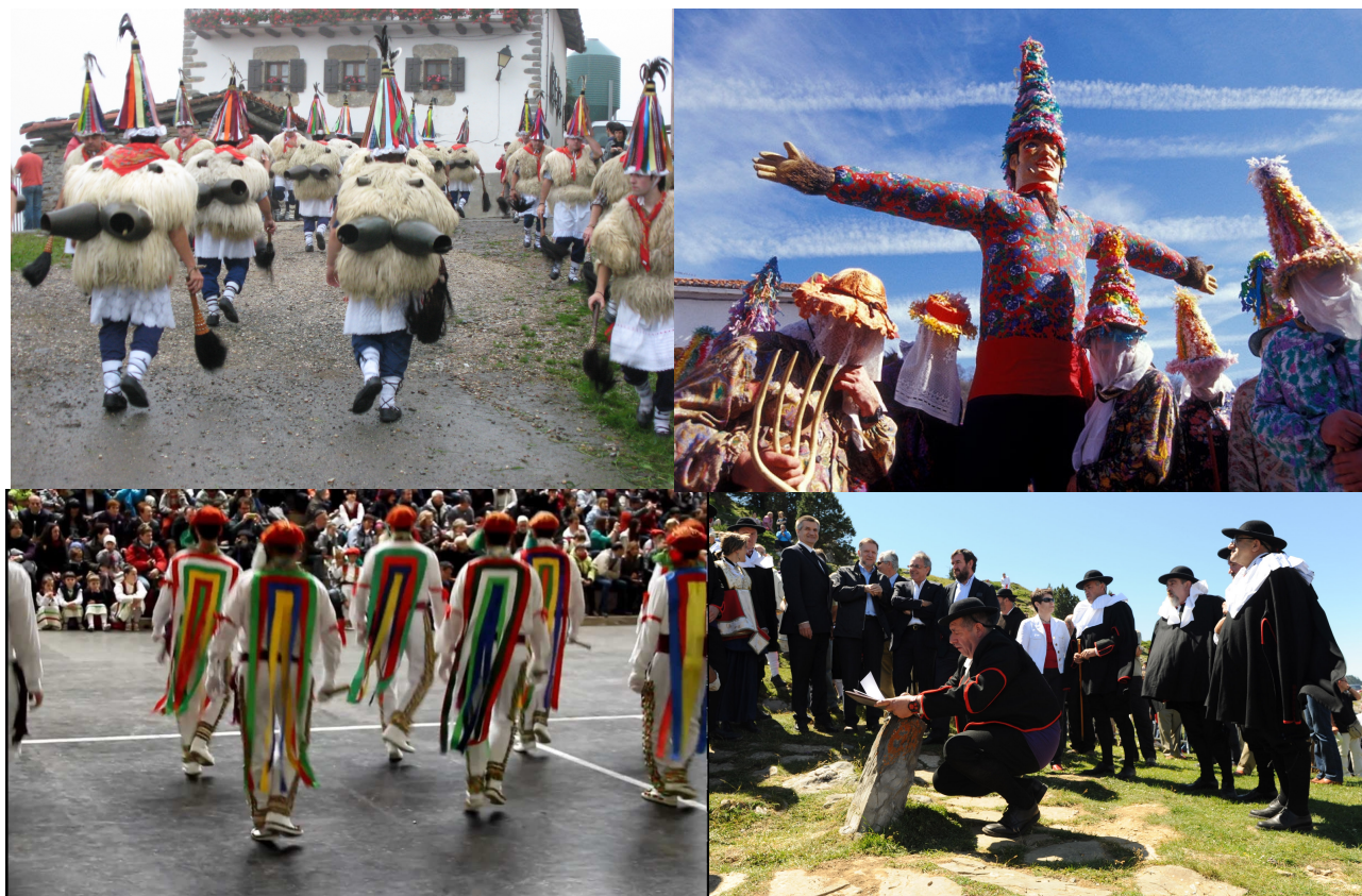
Fotos (de izquierda a derecha y de arriba a abajo): Carnaval de Lanz, Carnavales de Ituren y Zubieta, Volantes de Valcarlos y el Tributo de las 3 vacas de Roncal y Baretous.

El patrimonio inmaterial aparece en mayor o menor medida considerado por todas estas instituciones, en cuanto a objeto de investigación, estudio, conservación y divulgación, aunque la predisposición e incidencia es diversa. En referencia a la música tradicional no existe un museo que la desarrolle de manera específica, por lo que este trabajo pretende analizar esta evidencia.