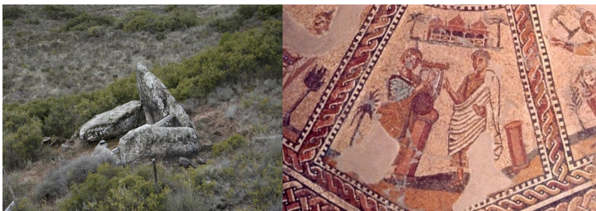
Fotos (de izquierda a derecha): Dolmen de Aizibitia y Mosaico de las Musas con Terpsícore tocando una lira.

Lo más común en museos generalistas es encontrar alusiones artísticas hacia la música sin ser exactamente objetos de transmisión musical pese a tener un significado referido a la música.