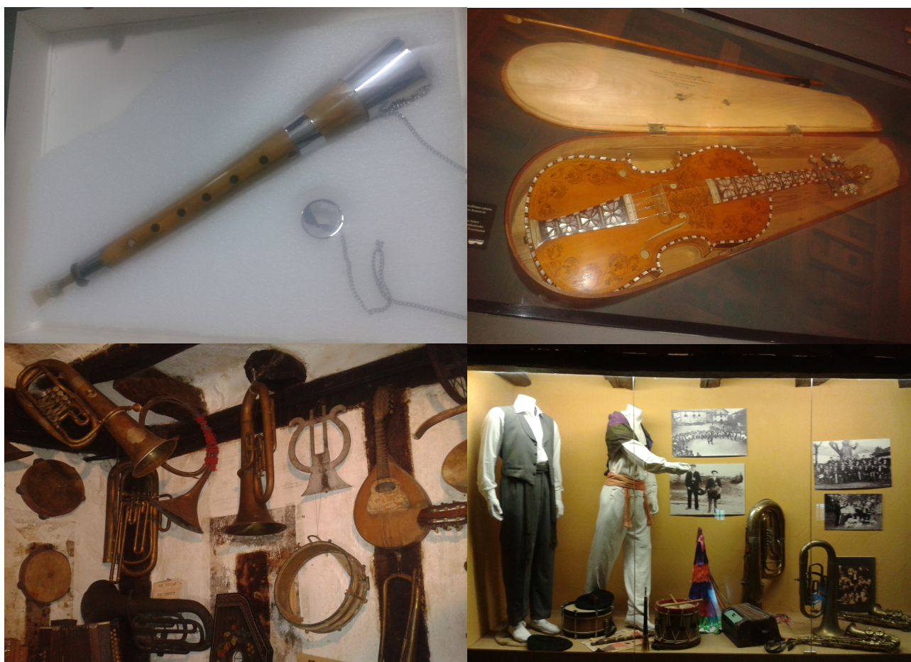
Fotos (de izquierda a derecha y de arriba a abajo):Gaita construida con torno tradicional, museo Etnológico de Navarra “Julio Caro Baroja”; violín perteneciente a Pablo Sarasate, Museo de Sarasate; Instrumentos tradicionales Museo Etnográfico de Arteta; y trajes e instrumentos tradicionales del valle del Baztán, Museo Etnográfico de Elizondo.

Por último también se llegan a exponer partituras, textos de canciones y todo tipo de documentación musical e instrumentos que pertenecieron a músicos emblemáticos como ocurre en la Casa-Museo del famoso tenor Roncalés Julián Gayarre o en Museo de Pablo Sarasate. Incluso en el Museo de la Almadía de Burgui se descubren trazos musicales en una canción convertida en himno dedicado a los almadieros (en anexo 8).