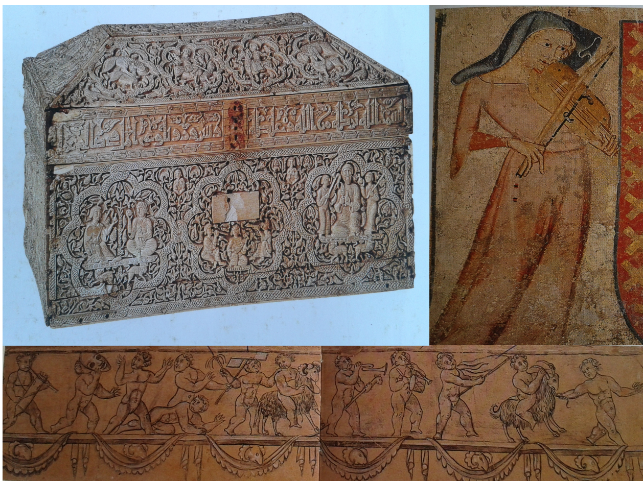
Fotos (de izquierda a derecha): Sitara en la parte central de la arqueta de Leyre; detalle de una juglaresa del mural de Juan de Oliver; danzantes y músicos representados en las grisallas del mural del palacio de Órizi.

En otros museos visitados se encuentra sobre todo representación organológica basada en instrumentos tradicionales como una gaita y un txistu en el Museo Etnológico de Navarra “Julio Caro Baroja” o instrumentos cotidianos de la cultura popular en los Museos Etnográficos del