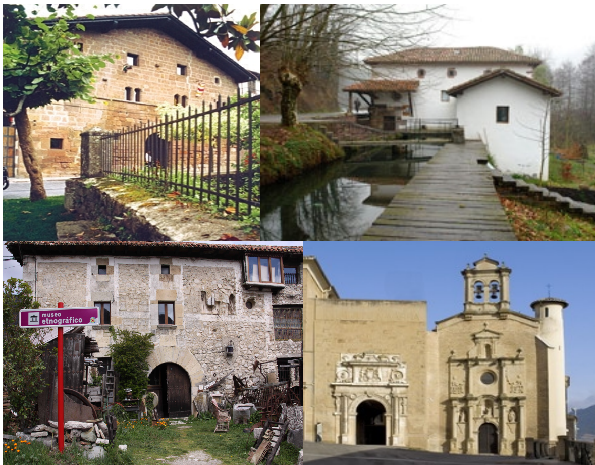
Fotos (de izquierda a derecha y de arriba a abajo): Museo Etnográfico Jorge Oteiza (Elizondo, Baztán); Ecomuseo del molino de Zubieta; Museo Etnográfico de Arteta; Museo de Navarra (Pamplona).

Museo de Pablo Sarasate (Pamplona) http://www.pablosarasate.com