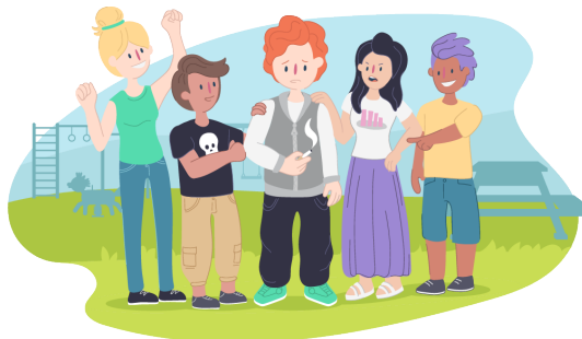
Rajah 2. Kumpulan Rakan Sebaya

depan yang gelap kerana telah dicemari dengan niat yang salah. Lantas, perasaan ingin tahu yang wujud dalam diri mereka akan mendorong mereka melakukan apa sahaja tanpa memikirkan baik atau buruknya perkara-perkara tersebut terlebih dahulu lebih-lebih lagi kerana mereka berada dalam kumpulan rakan sebaya yang akan melakukan perkara tersebut bersama-sama mereka. Kumpulan rakan sebaya dibentangkan pada Rajah 2.