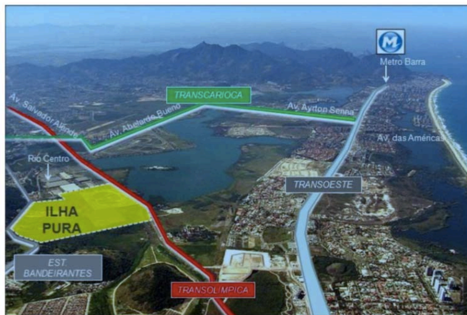
Figura 1. Localização do Bairro Ilha Pura

para atender a demanda dos Atletas das Olimpíadas RIO2016 e posteriormente foram vendidas as unidades para o público geral. Do ponto de vista urbanístico a implantação do bairro foi importante para o desenvolvimento da mobilidade urbana na Barra da Tijuca e seu entorno. A construção de grandes vias, como a Transoeste, Transolímpica e Transcarioca, encurtaram as distâncias entre outros locais da cidade e facilitaram o acesso a outras macrorregiões, como mostra a figura 1 abaixo: