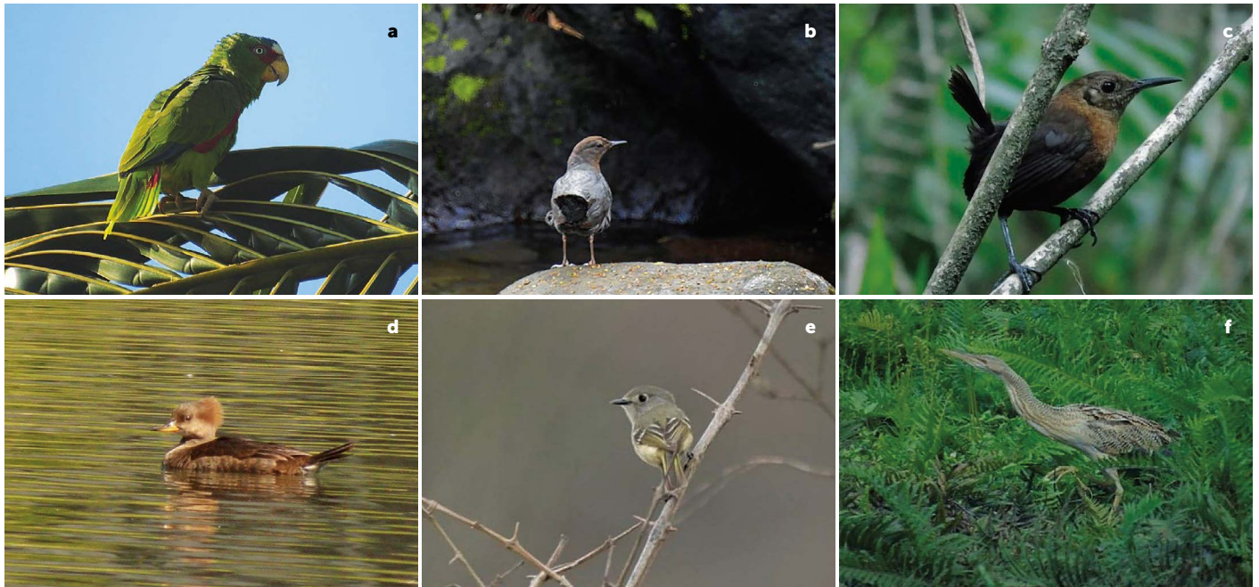
Figura 2. Avifauna de la RAMV. a) Loro Frente Blanca ( Amazona albifrons ), observado en Córdoba, b) Mirlo Acuático Norteamericano ( Cinclus mexicanus ), registrado en Chocamán, c) Cuevero de Sumichrast ( Hylorchilus sumichrasti ), observado en Córdoba, d) Mergo Cresta Blanca ( Lophodytes cucullatus ), observado en Orizaba, e) Vireo Enano ( Vireo nelsoni ), registrado en Aculzingo y f) Avetoro Neotropical ( Botaurus pinnatus ), observado en Córdoba.