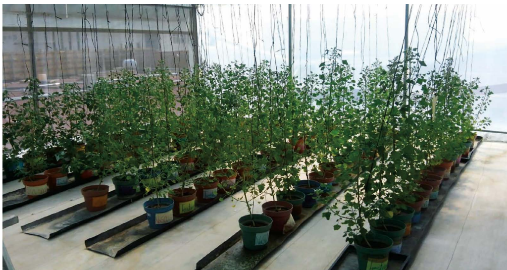
Figura 2. Cultivo de quinoa bajo condiciones de invernadero en semi-hidroponía con diferentes niveles de conductividad eléctrica debido a salinidad sulfática.

las células una relación K^+/Na^+ alta. Además, Ramírez y Hernández (2016), mencionan que los mecanismos de respuesta de las plantas al estrés salino se pueden resumir en tres fases fundamentales: 1) ajuste osmótico, 2) homeostasis iónica, y 3) eliminación de especies reactivas de oxígeno.