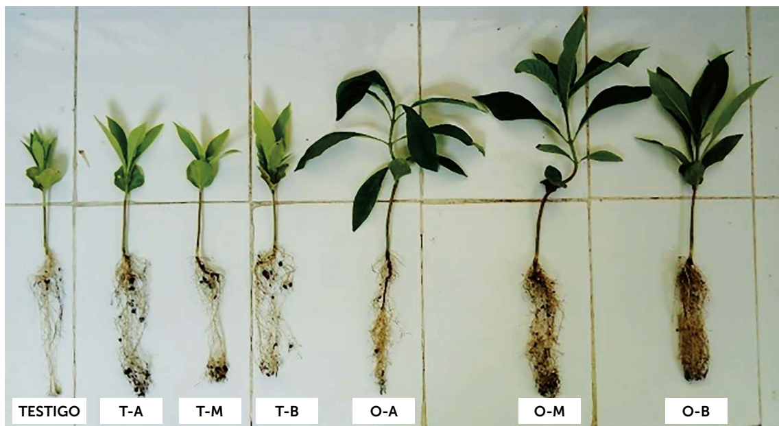
Figura 1. Efecto de dos formulaciones de fertilizantes a diferentes dosis en las características morfológicas de plantas de jagua ( G. americana L.) de tres meses de edad en vivero. T-A=Triple 17 en dosis alta, T.M=Triple 17 en dosis media, T-B=Triple 17 en dosis baja, O-A=Osmocote® en dosis alta, O-M=Osmocote® en dosis media y O-B=Osmocote® en dosis baja.

Del análisis estadístico del experimento factorial se observaron diferencias estadísticas significativas entre los fertilizantes Osmocote® y Triple 17 en el diámetro y altura, siendo estadísticamente mejor el fertilizante Osmocote®, con el que se obtuvo un diámetro de 4.235 mm y una altura de 17.465 cm en promedio. Por lo que respecta a la longitud de raíces no se observaron diferencias significativas entre tipos de fertilizantes. Con relación al