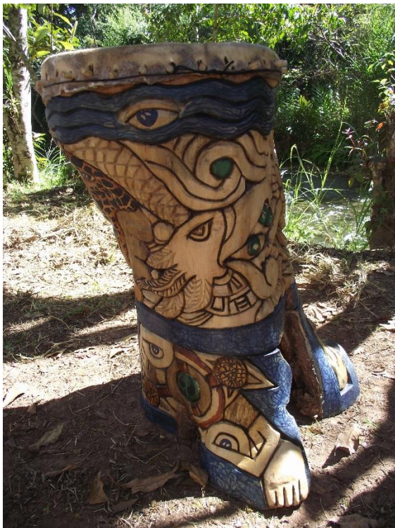
4. Huehuetl