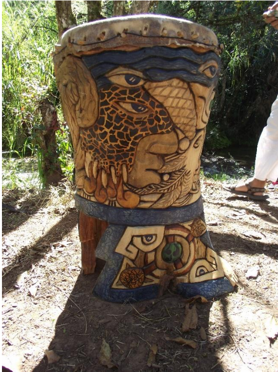
3. Huehuetl