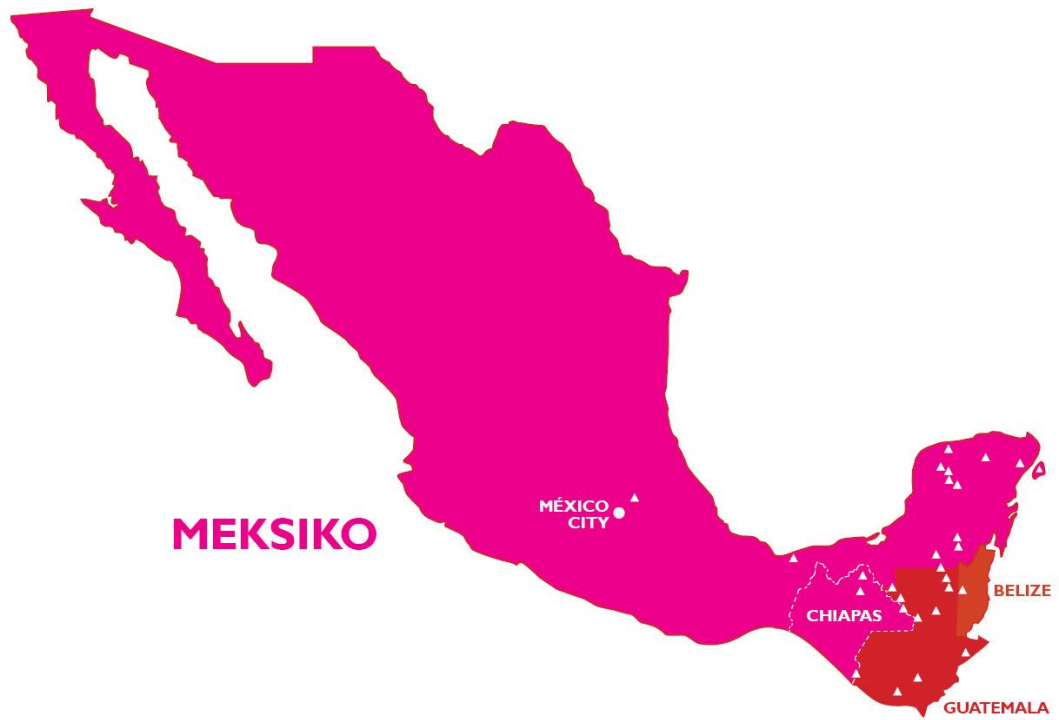
Kartta 1. Muinaisten maya-tempeleiden (teocallis) sijoittuminen