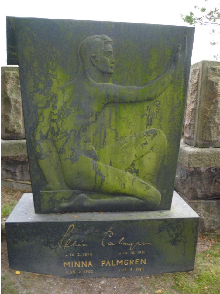
Selim Palmgren (numero 14).