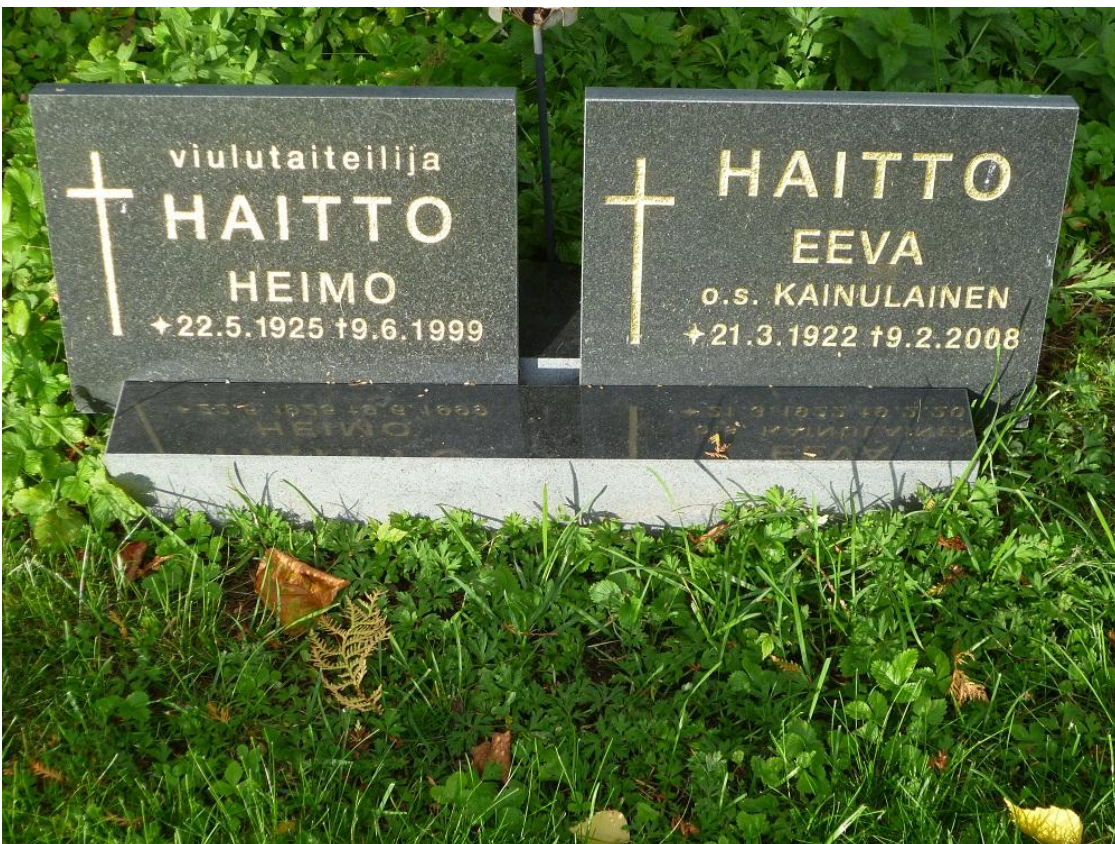
Heimo Haitto (numero 36).