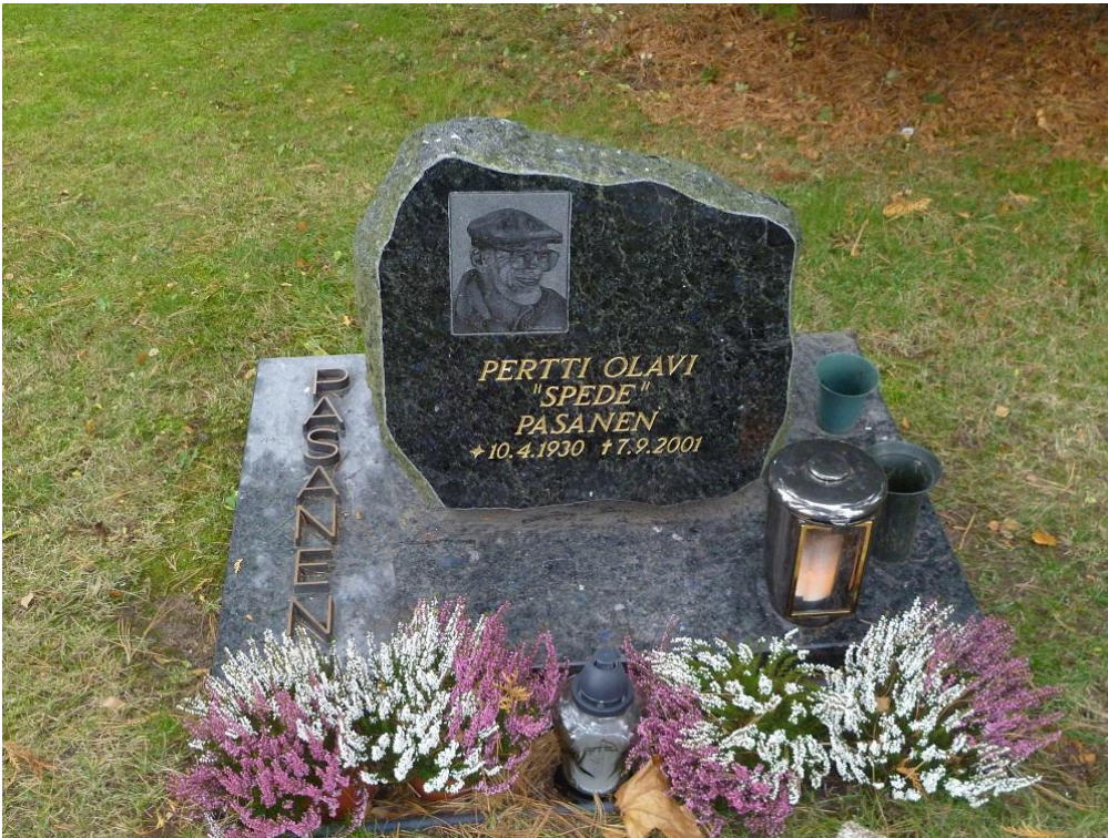
Pertti "Spede" Pasanen (numero 29).