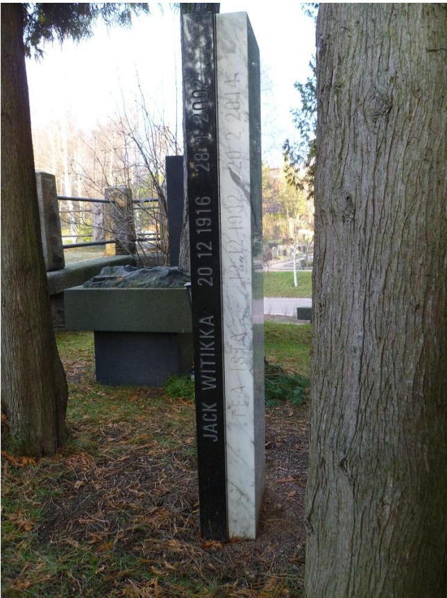
Jack Witikka ja Tea Ista (numero 13).