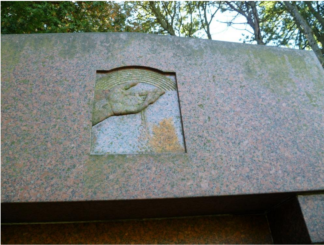
Yksityiskohta Gallen-Kallelan hautakammioista.