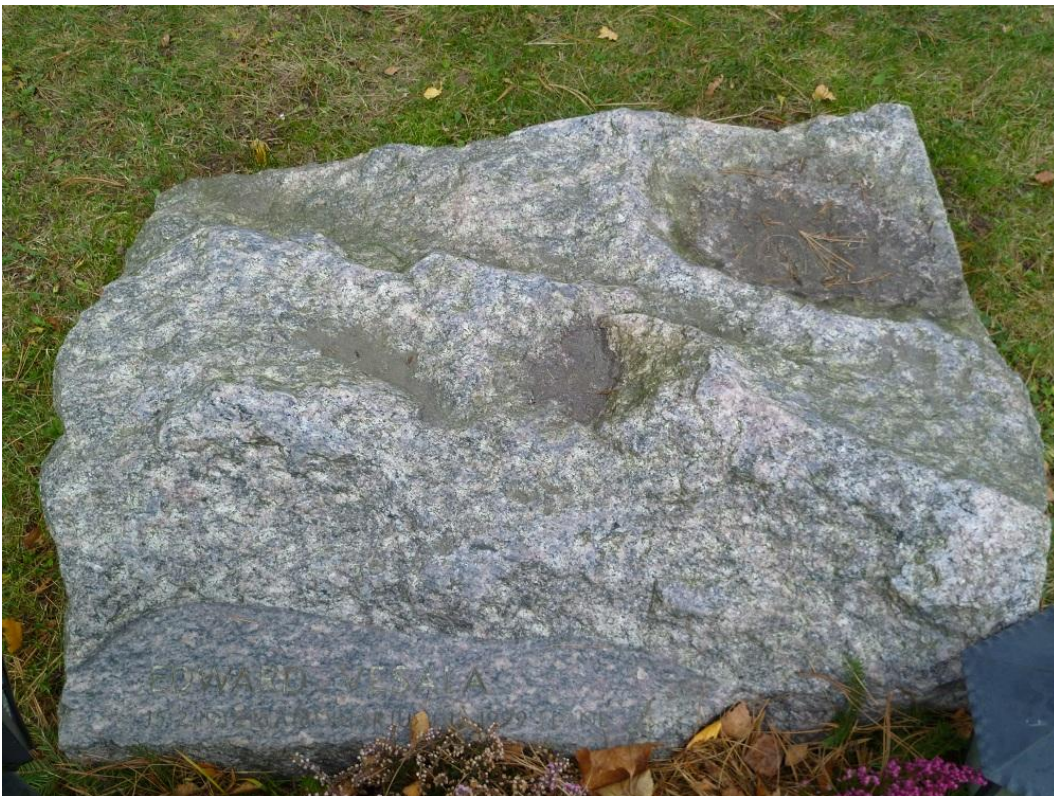
Edward Vesala (numero 27).