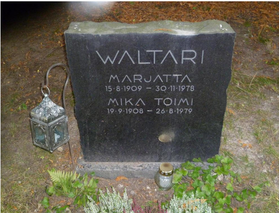
Mika Waltari (numero 9).