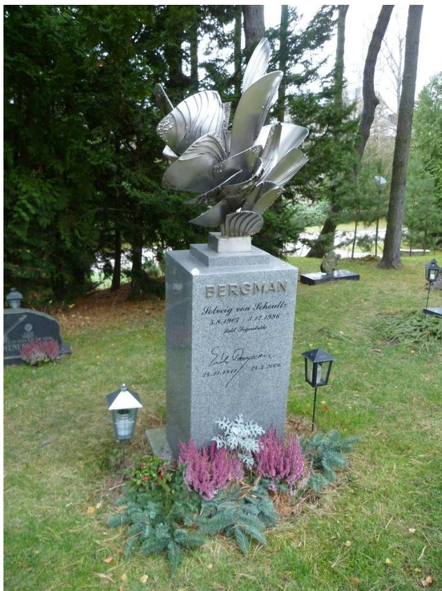
Solveig von Schoultz ja Erik Bergman (numero 21). 9.11.2010.