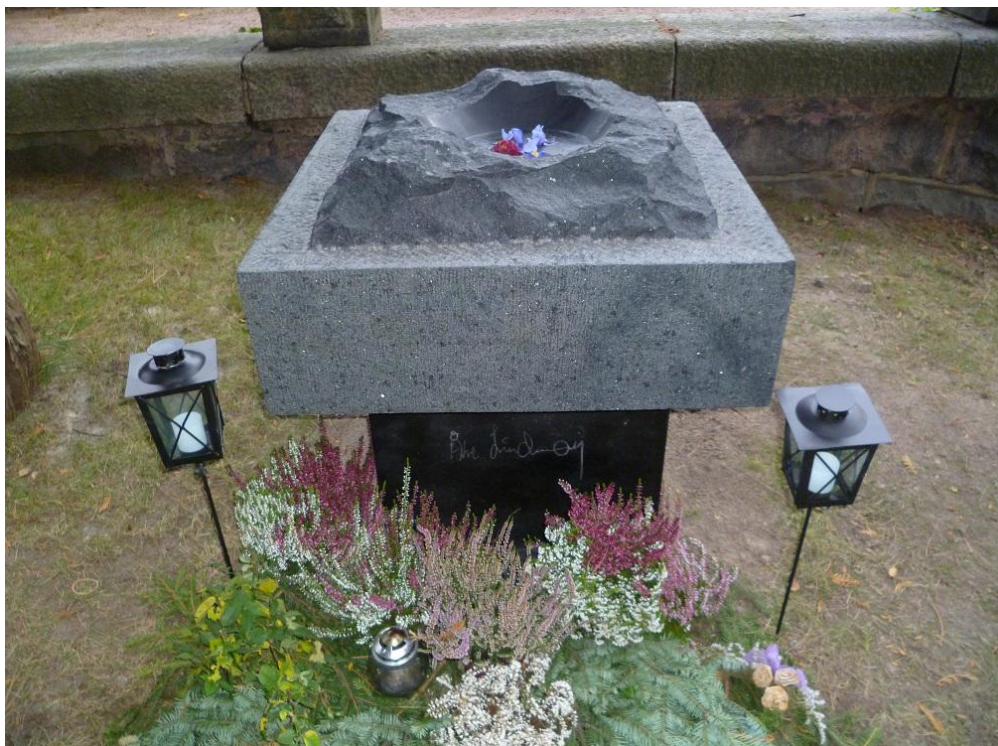
Åke Lindman (numero 47).