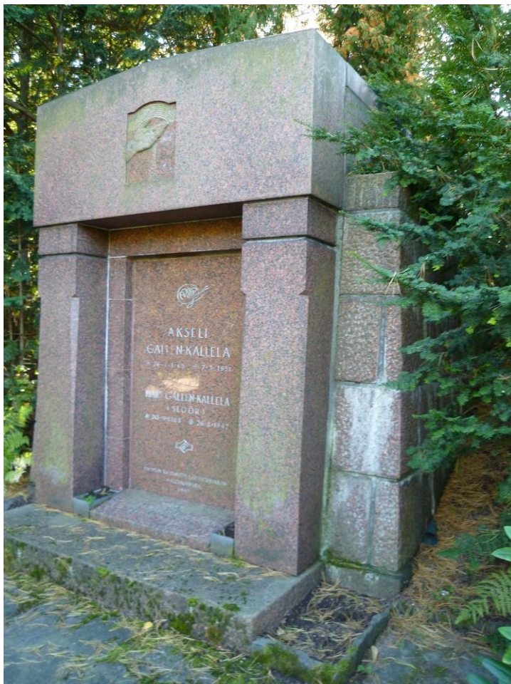
Akseli Gallen-Kallela (numero 19).