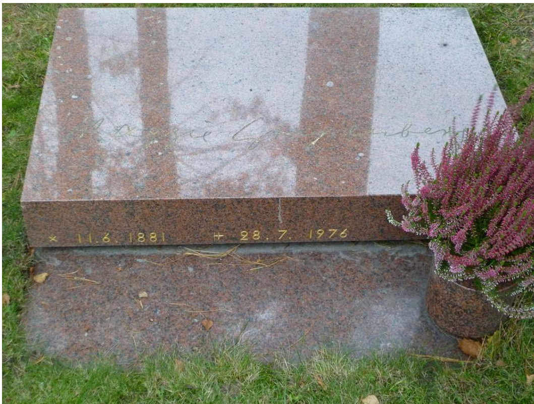
Maggie Gripenberg (numero 1).