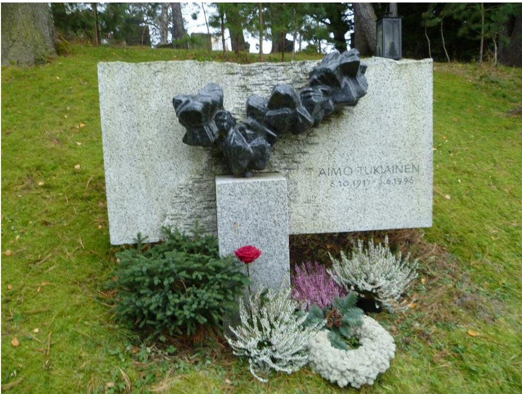
Aimo Tukiainen (numero 20).