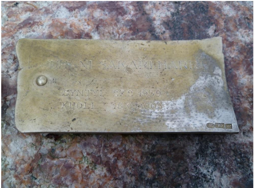
Yksityiskohta Juhani Harrin hautamuistomerkestä.