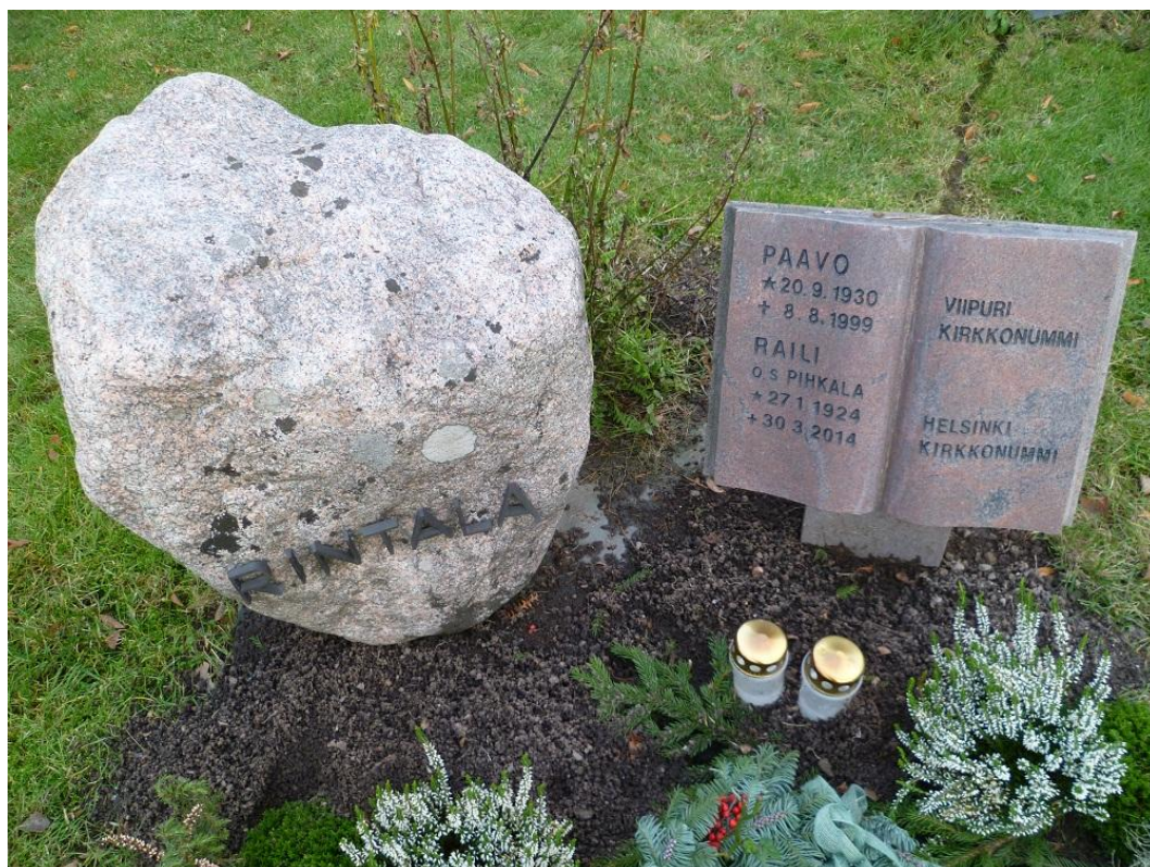
Paavo Rintala (numero 28). 30.11.2014.