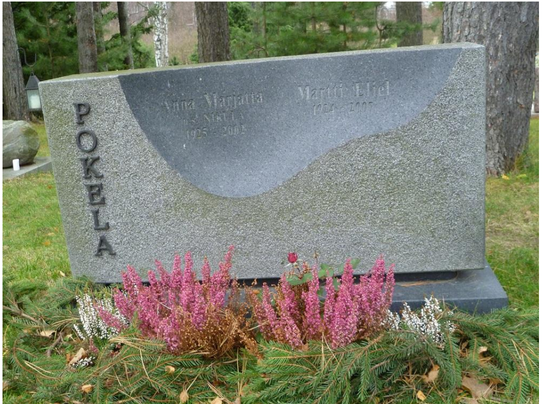
Martti Pokela ja Marjatta Pokela (numero 31).