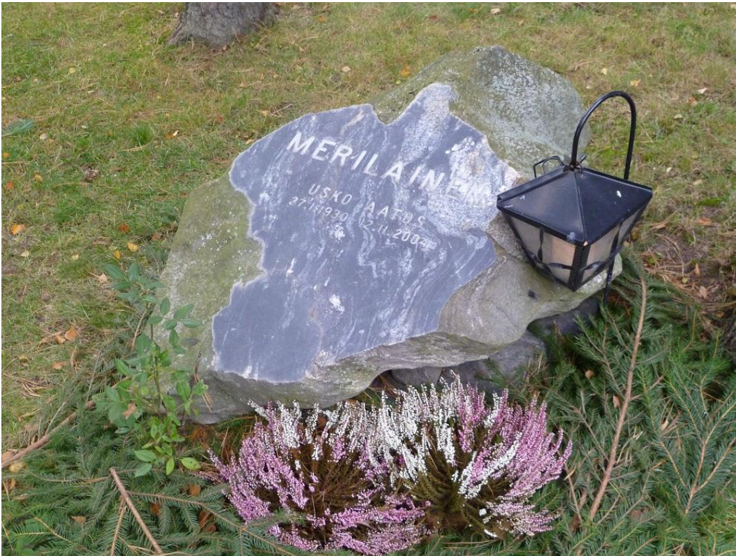
Usko Meriläinen (numero 35).