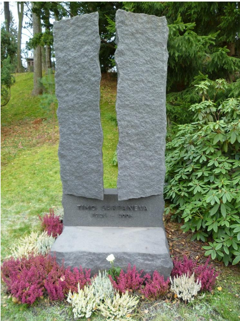
Timo Sarpaneva (numero 43).