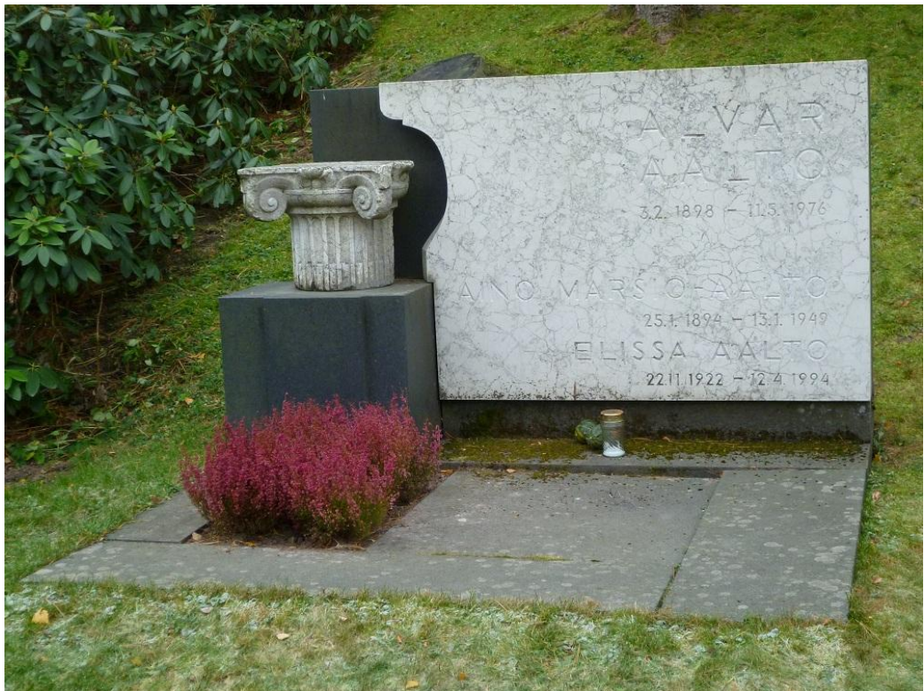
Alvar Aalto (numero 16).