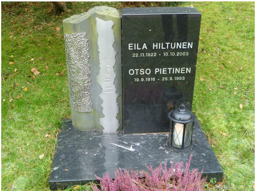
Eila Hiltunen (numero 33).