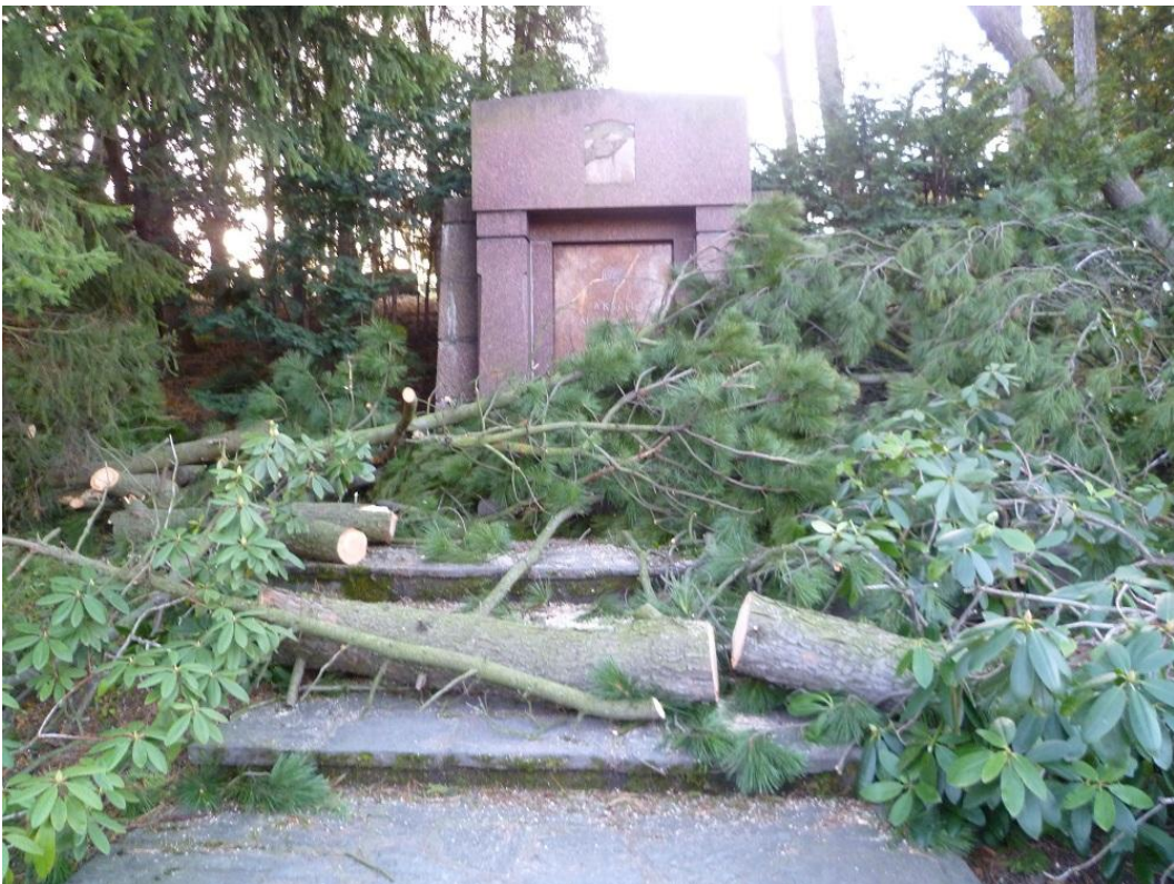
Tapaninpäivänä 26.12.2011 myrsky kaatoi puita.