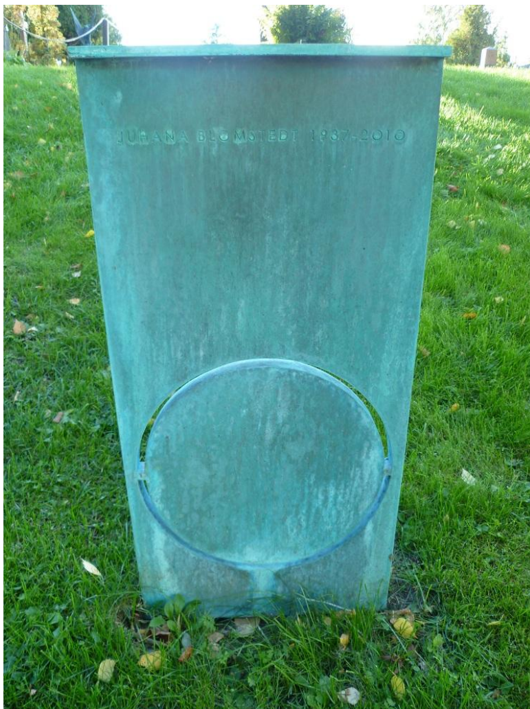
Juhana Blomstedt (numero 49).