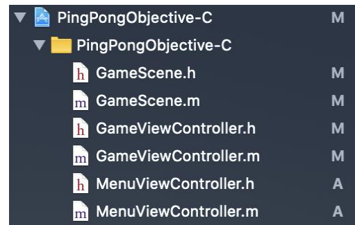
Rysunek 2. Fragment struktury gry ping-pong w języku Objective-C.

Składnia omawianych języków programowania jest bardzo podobna do siebie, natomiast różnice występują w strukturze kodu. Język Swift ma zdecydowanie prostszą i bezpieczniejszą strukturę, co dowodzi brak konieczności stawiania średników na końcu liniiki. Dodatkowo same odwołanie się do metod odbywa się podobnie, jak we współczesnych językach programowania. Przykładem tego jest obiekt touches, prezentowany w metodzie touchesBegan (listing 1). W przypadku technologii Swift wywołanie metody odbywa się poprzez dodanie do obiektu kropki a następnie nazwy metody, co widać na listingu 1. W Objective-C ta sama czynność odbywa się poprzez dodanie nawiasów kwadratowych przed obiektem, następnie oddzielenie spacją obiektu od metody wywołującej zamknięcie nawiasu oraz postawienie średnika po zakończonej czynności (Listing 2).