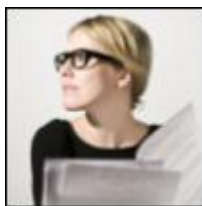
Аватар автора блога

Каждый пост в блоге Собчак представляет собой отдельный памфлет и посвящен одной теме. Посты длинные, и одни и те же мысли в них выражаются иногда несколько раз разными словами или под разными углами зрения. В блоге Собчак опубликовано много видео, в которых автор кажется сильной и иногда агрессивной. Письменно она, наоборот, ищет какого-то компромисса с противниками, требует терпения и представляют себя примирителем, выдержанным реалистом. Собчак пишет практически исключительно о политике. В собранном материале первый блогпост (18.1.2012) о выборах и отношении кандидатов к электорату. Второй блогпост (22.1.2012) посвящен вопросу о том, какая должна быть демонстрация против настоящей системы. Третий блогпост (28.1.2012) о том, как Собчак относится к агрессивным постам полученным ей. Темой четвертого блогпоста (20.2.2012) являются большие философские вопросы о политических идеологиях. В пятом блогпосте (13.3.2012) автор описывает случай, имевший место в ресторане, где журналисты старались записать ее разговор без ее согласия.