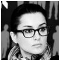
Аватар автора блога

собранном материале первый блогпост (18.1.2012) посвящен корпоративу, и Канделаки представляет своих коллег. Второй блогпост (24.1.2012) – о ее сайте-проекте «умная-школа.рф», третий блогпост (30.1.2012) о том, что она запускает новую политическую программу на своем YouTube-канале. Четвертым блогпостом (20.2.2012) является ссылка на радиопрограмму, в которой говорится о выборах в России и Америке. В пятом блогпосте (12.3.2012) следует длинный анализ выборов в Государственную Думу, и особенно работы наблюдателей на них. Один из постов в нашей выборке – это аудиозапись (20.2.2012) – оставлен вне рассмотрения.