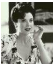
Аватар автора блога

В собранном материале первые семь блогпостов (18.1.2012) являются короткими замечаниями о дорожных работах на Рублевском шоссе в Москве, здесь есть комментарий к блогу Собчак, ссылка на ее «любимый сайт», ее впечатление о политической телепередачи на Первом канале и три коротких комментария к политике. Блогпосты от 22.1.2012 посвящены блогу Собчак от того же дня и сломанному браслету марки Chanel . Блогпост от 28.1.2012 о том, как неудачно она съездила в Израиль. Темой блогпоста от 20.2.2012 являются юмористские подходы к президентским выборам. В пятый анализируемый день в блоге (13.3.2012) опубликовано семь коротких комментариев. Первый из них поддерживает Собчак, которую старались записать в ресторане без разрешения. Второй и третий являются ссылками на новости о политических событиях в России. Четвертой блогпост – это ссылка на пост Собчак, связанный со случаем в ресторане. Пятой и шестой блогпосты касаются полковника ФСБ, который разбил зеркало в машине постороннего человека и уехал с места. Последний блогпост от 13.3.2012 является критикой LifeNews, новостного портала, который старался записать Собчак в ресторане.