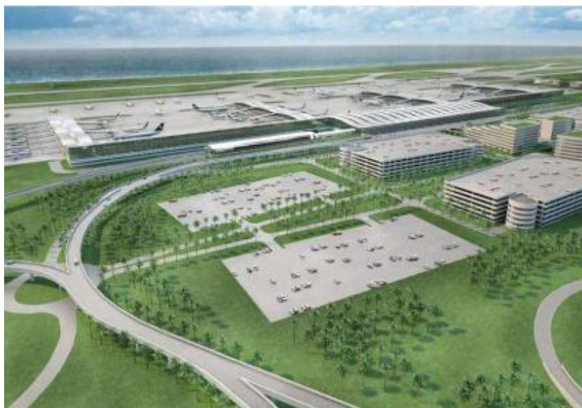
Gambar 1. Desain terminal YIA

Yogyakarta International Airport (YIA) terletak di Kecamatan Temon Kabupaten Kulon Progo Provinsi Daerah Istimewa Yogyakarta dengan kordinat landasan pacu bandar udara terletak pada kordinat geografis 70°54'39,20" lintang selatan dan 110°4'21,11" bujur timur atau pada kordinat bandar udara X = 18.400 meter dan Y = 20.080 meter dimana sumbu X berimpit dengan sumbu landasan yang mempunyai azimuth 290° 0' 0" geografis dan sumbu Y melalui ujung landasan pacu 29 tegak lurus pada sumbu X. Luas lahan untuk kebutuhan pembangunan Bandar Udara baru di Kabupaten Kulon Progo adalah sebesar 634 Ha. Lebih jelas perhatikan gambar berikut.