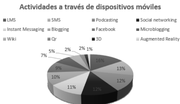
Fig.4. Actividades a través de dispositivos móviles [63]

objetos en 3D (2) y por último la realidad aumentada (1%).