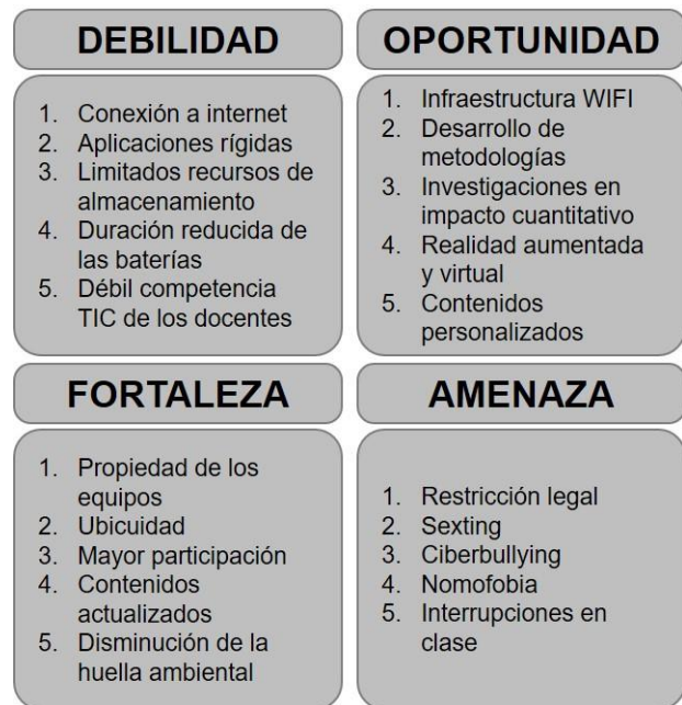
Fig.1. Matriz DOFA del M- Learning

implementación del aprendizaje móvil [59], podría desencadenar el desarrollo de tecnológico, mejorar los entornos educativos en línea, el desarrollo de metodologías emergentes, es decir, aumentar las investigaciones del aprendizaje personalizado y experiencias inmersivas por medio de la realidad aumentada y virtual, a demás de las fortalezas asociadas a la educación mediada por la tecnología móvil. En la Figura 1, se resume en una matriz DOFA (debilidades, oportunidades, fortalezas y amenazas) las diferentes posturas de la implementación del M-Learning .