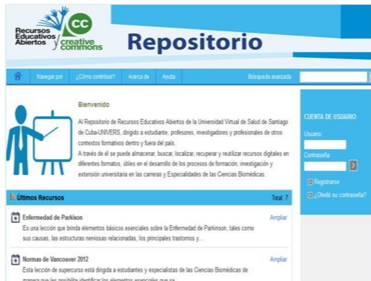
Fig. 4. Repositorio de Recursos Educativos Abiertos

También resaltan los objetos de aprendizaje disponibles en el Repositorio de Supercurso y el de Recursos Educativos Abiertos (Fig. 4).