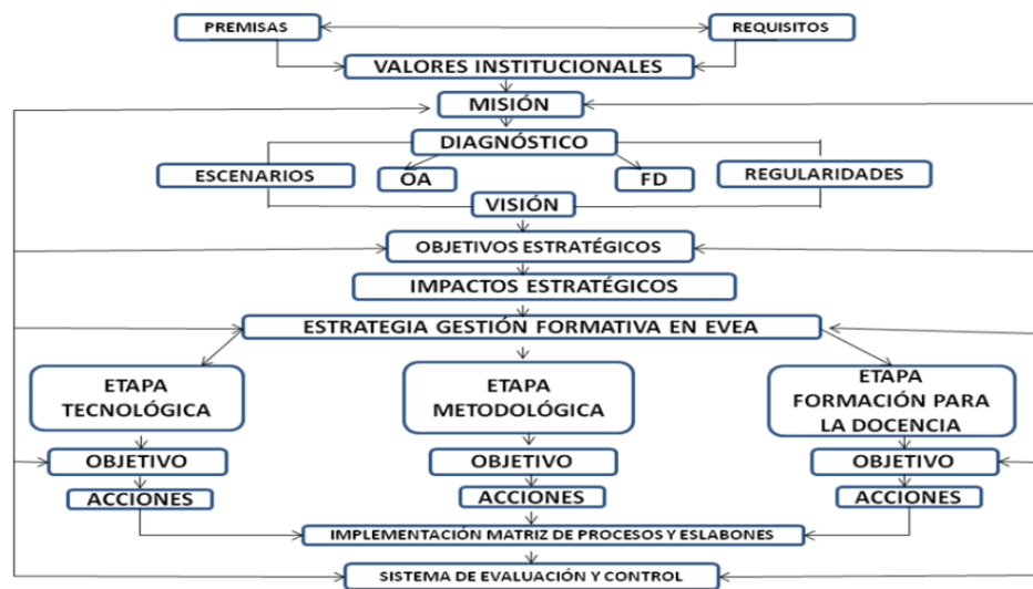
Fig. 1. Estrategia para la Gestión Académica en el Entorno Virtual de Ciencias Médicas

La estrategia que se propone (Fig. 1), toma en consideración en su macroestrategia, las regularidades que caracterizan el desarrollo del proceso de formación profesional (PFP) en las carreras de las Ciencias Médicas y en su microestrategia, las regularidades de la dinámica de la gestión de ese proceso con el empleo de UNIVERS. Su concepción y posterior ejemplificación se sustentó en la aplicación del método sistémico – estructural – funcional así como se establecieron un conjunto de procedimientos que relacionados dialécticamente posibilitaron desarrollar la Gestión formativa en EVEA, para las carreras de las Ciencias Médicas.