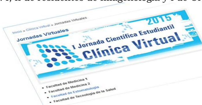
Fig. 2. Jornada Virtual

Lo anterior, posibilitó que en las diferentes carreras se desarrollaran las Jornadas Científicas Estudiantiles: I Jornada de Informática Médica y I, II Jornadas de Clínica Virtual así como las Jornadas de Clínica Virtual por especialidades: I, II de residentes de Imagenología y I de Ortodoncia (Fig. 2).