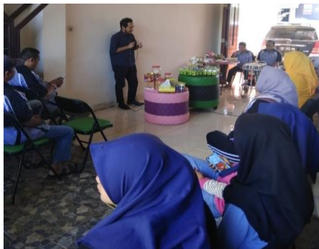
Gambar 2. Pelaksanaan pelatihan

Pelatihan diberikan dalam bentuk ceramah yang dilanjutkan dengan eksperimen langsung dan tanya jawab (Sugiyono, 2006; Miles & Huberman, 1994). Materi yang disampaikan adalah wirausaha dan peluang usaha rumahan, prinsip dasar pembuatan produk, pengemasan dan pemasaran produk, khususnya produk sabun dan deterjen. Praktek cara pembuatan pembuatan deterjen, sabun cuci tangan, sabun cuci piring serta pelembut dan pewangi pakaian. Warga dibagi ke dalam beberapa kelompok, kemudian dengan dibimbing Tim pengabdian mempraktekkan sendiri pembuatan produk tersebut yang disajikan pada Gambar 2.