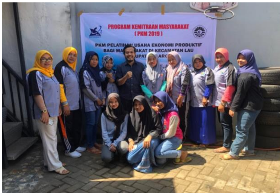
Gambar 3. Foto bersama