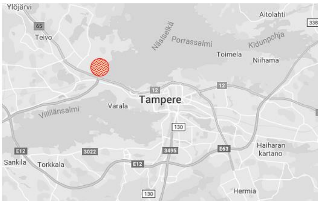
Kuvio 2: Hiedanranta kartalla. Alue on merkitty karttaan punaisella ympyrällä.

Hiedanranta sijaitsee Tampereella, noin neljä kilometriä keskustasta länteen. Alue rajautuu vilkkaasti liikennöityyn Paasikiventiehen, Näsijärveen, Niemenrannan alueeseen sekä Lielahden kaupalliseen keskittymään. Hiedanrannan alue on kooltaan noin 246 hehtaaria ja se koostuu entisen Metsä Boardin sellutehtaan alueesta, osasta Lielahden kaupallista aluetta sekä osasta Näsijärven eteläistä ranta-alueutta (Rakennesuunnitelma 2017). Alue on tällä hetkellä voimakkaassa muutoksessa Tampereen kaupungin kehittäessä entistä teollisuuden keskittymää uudeksi, kestäväksi ja älykkääksi kaupunginosaksi.