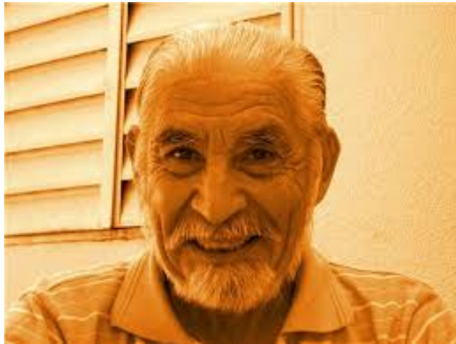
IMAGEN DE CIERRE

http://ictiologiaargentina.blogspot.com/