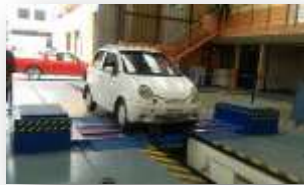
Fig. 2.- Vehículo Daewoo Matiz en Dinamómetro

El vehículo Daewoo Matiz con motor F8CV de 0.8 L, para probar su nuevo rendimiento, se sometió a una prueba realizada con un dinamómetro en la ciudad de cuenca en la Escuela Superior Politécnica Salesiana, en la facultad de Ingeniería Mecánica, ahí determinaron que el vehículo está cerca de cumplir con las características de un vehículo con un motor nuevo.