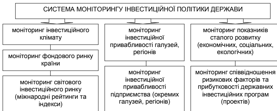
Рис. 1. Елементи системи моніторингу інвестиційної політики держави.

Інвестиційна політика повинна ґрунтуватися на комплексі чітко сформульованих цілей зі зрозумілими пріоритетами і часовими рамками для їх досягнення.