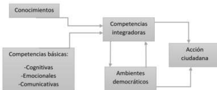
Figura 1. Dimensiones fundamentales para la acción ciudadana.

Las políticas, directrices y docentes de los centros educativos poseen una relación con las competencias ciudadanas, ya que en estas instituciones también es formado el estudiantado, promoviendo la formación ciudadana, integrando la enseñanza en sus áreas académicas.