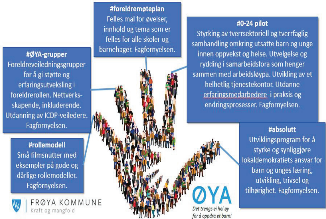
Figur 2. Beskrivelse av Øya-prosjektet