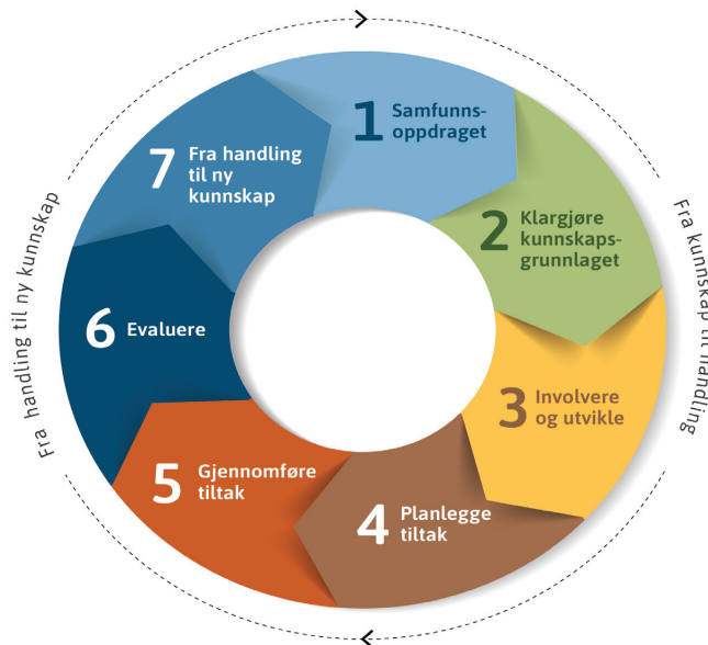
Figur 1. Trøndelagsmodellen for folkehelsearbeid

Hentet fra Helsedirektoratets beskrivelse av Program for folkehelsearbeid (Helsedirektoratet, 2019)