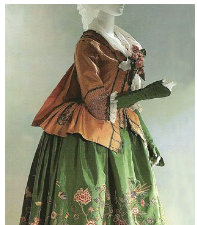
Іл.9. Карако і спідниця. Франція, бл. 1775р.