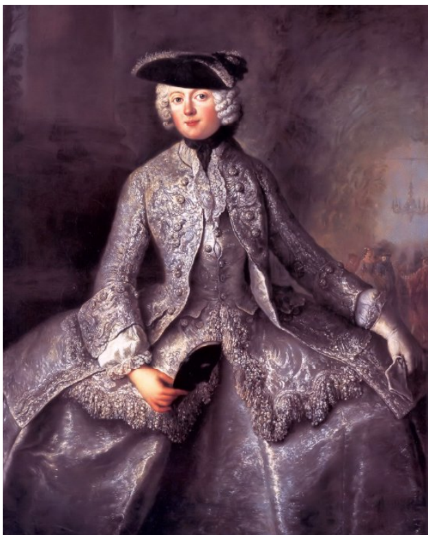
Іл.1. А.Пен. Амалия Пруська