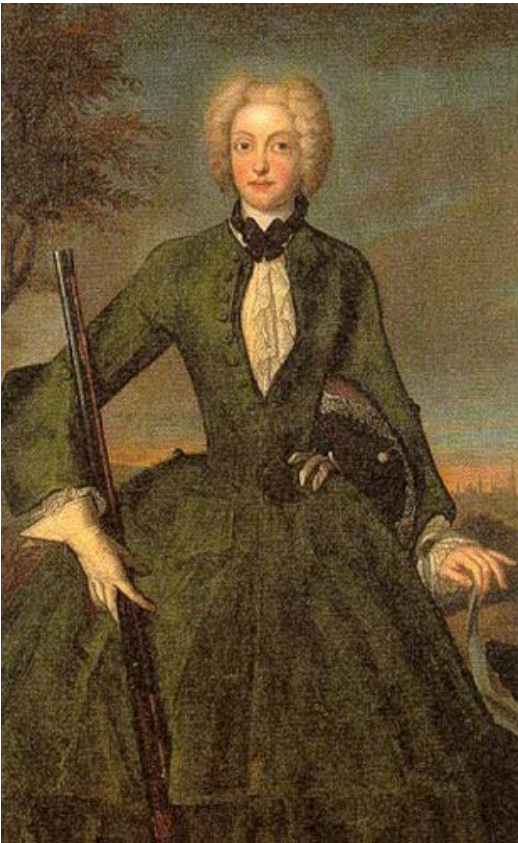
Іл.5. Й. Вивьєн. Портрет Марії Амалії Баварії. XVIII ст.