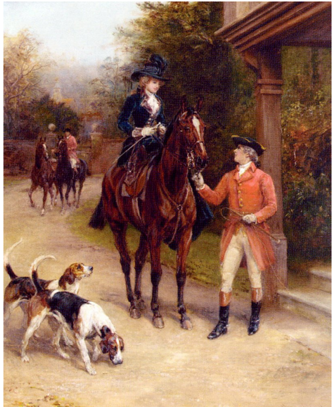
Іл.6. Х. Харді. Ранкове полювання.