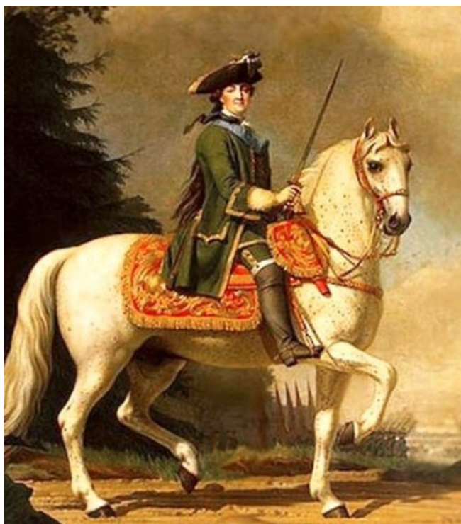
Іл.3. Віргіліус Е.. Портрет веришки Катерини Великої