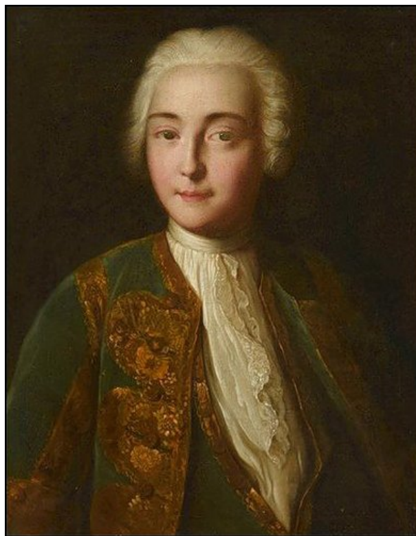
Іл.2. Невідомий художник. Імператриця Єлизавета в чоловічому костюмі