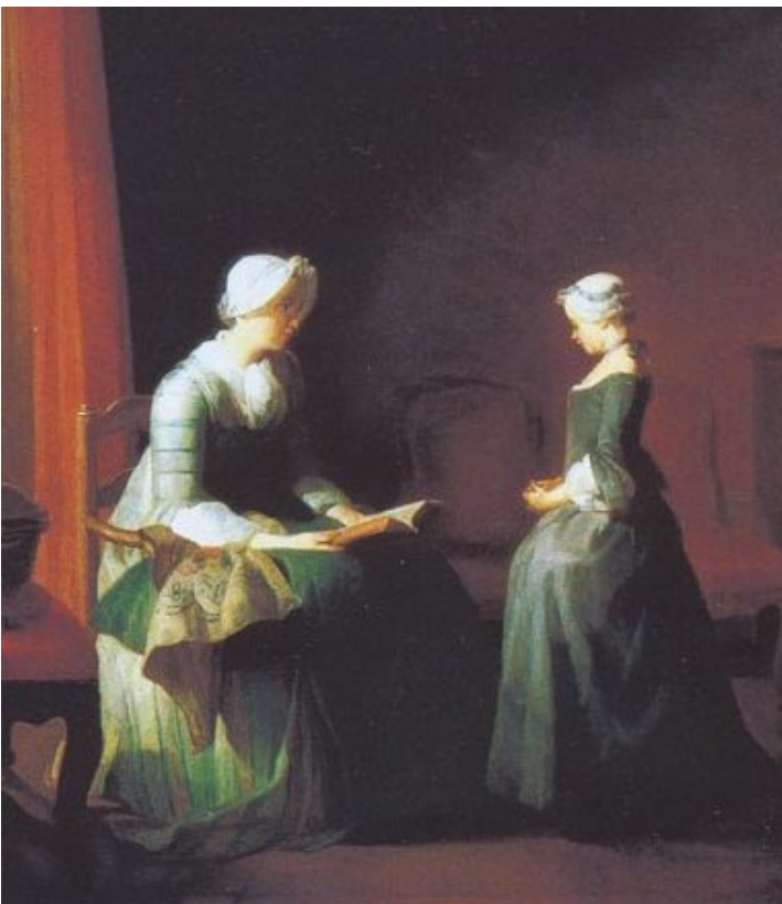
Іл.7. Ж.-Б. Шарден. Хороше виховання. 1753р.