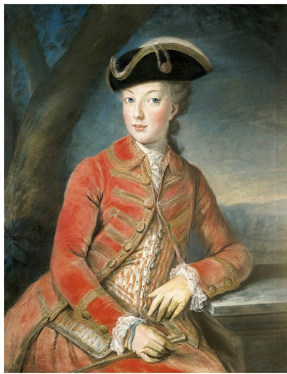
Іл.4. Й. Крайтзинджер. Молода Марія Антуанетта. 1771р.

особливим статусом і означав перш за все право на військові розпорядження» [5, 74]. Наголосимо на знаковій функції костюма: саме чоловічий костюм посилював повноваження особи, здавалося б, і без того наділеною достатньою владою. Але військові розпорядження надавалися армії, яку складали чоловіки, і для їх здійснення імператорській особі було не досить