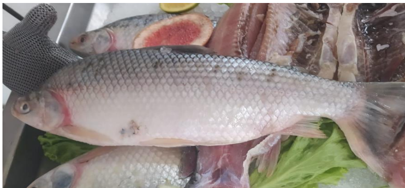
Figura 1. Bocachico ( Prochilodus magdalenae ). Supermercado Euro. 8/Marzo/2020

Hábitat y reproducción: es originario de la cuenca del río Magdalena, se encuentra principalmente en el fondo, es un pez succionador. Los machos miden al menos 30 cm, pero puede llegar a alcanzar los 50 cm de longitud total. La boca es pequeña, carnosa y prominente; provista de una serie de dientes diminutos en los labios; presenta espina predorsal punzante. El cuerpo es de color plateado uniforme; las aletas tienen matices rojos o amarillos; escamas rugosas al tacto Maldonado, Ortega, Usma, Galvis, Villa, Vasquez y Prada (2005).