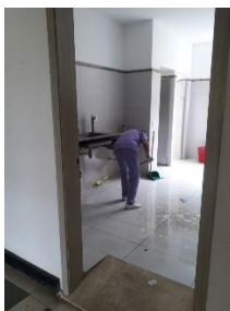
Figura 5: Estudiante de práctica y personal de la Unidad Materno Infantil