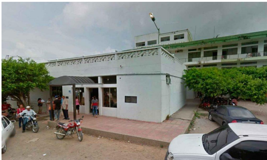
Imagen de la E.S.E Hospital San Diego de Cereté