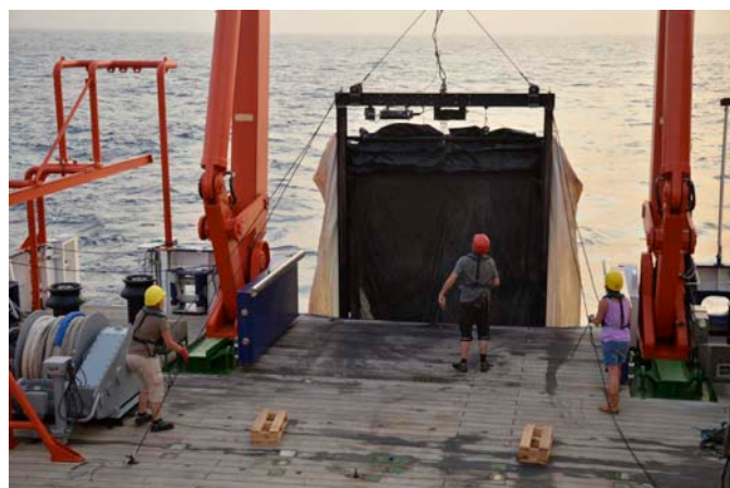
Das 10m 2 -MOCNESS wird ausgesetzt

Das Arbeitsprogramm auf dieser Reise war auf allen Stationen gleich und umfaßte CTD/Rosetteprofile, Tag- und Nachtfänge mit den Mehrfachschließnetzen, dem 1m 2 - und dem 10 m 2 -MOCNESS, Tag- und Nachtprofile mit dem PELAGIOS und dem UVP sowie zusätzliche Einsätze eines einfachen Planktonnetzes, des WP 3 , zum besonders schonenden Fang von gelatinösen Organismen wie Quallen und Rippenquallen. Durch die Kombination der optischen Erfassungssysteme PELAGIOS und UVP mit den Mehrfachschließnetzen erwarten wir auf der einen Seite mit Hilfe der optischen Systeme genauere Informationen über die Verteilung auch empfindlicherer Organismen,