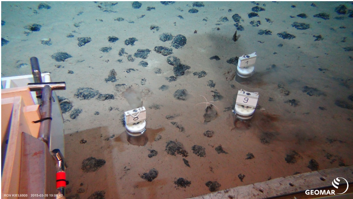
Abb. 2 Mit Hilfe des ROV werden Sedimentproben zwischen den Manganknollen gesammelt. Zu sehen ist auch ein Schlangensterne.