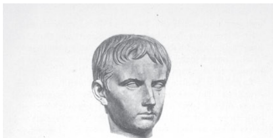
Fig. 3. Kopf des jungen Octavianus im Vatican.