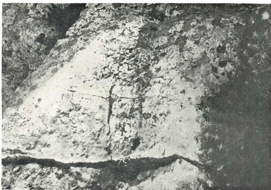
Ostaci zemljišnog križa na brdu Gradac