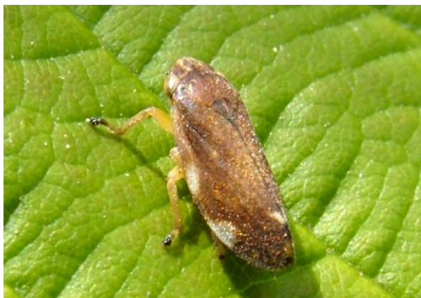
Slika 3. Odrasla jedinka Ph. spumarius , vektora karantenske bakterije Xylella fastidiosa.

floemskih bakterija reproducira intracelularno cirkulativnim, propagativnim putem (Perilla-Henao i Casteel, 2016.). Ovisno o potrebi, X. fastidiosa proizvodi različite toksine, izvanstanične polisaharide, adhezive i hemoglutinine zbog utjecanja na vektor poticanjem presvlačenja i virulentnog ponašanja (Nascimento i sur., 2016.). Korištenjem međustaničnih signalnih senzora i difuznih signalnih faktora (DSF) ova bakterija raspoznaje kada je i koji produkt potrebno proizvoditi zbog utjecaja na vektor i pojačanje vlastitog prijenosa (Perilla-Henao i Casteel, 2016.).