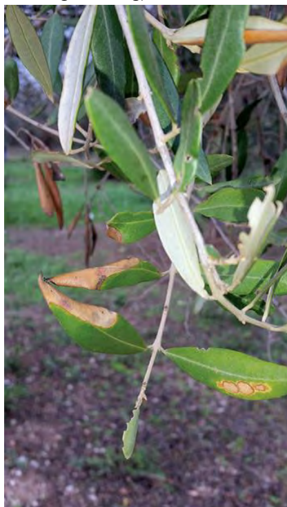
Slika 4. Rubne i vršne nekroze na lišću masline zaražene bakterijom Xylella fastidiosa.