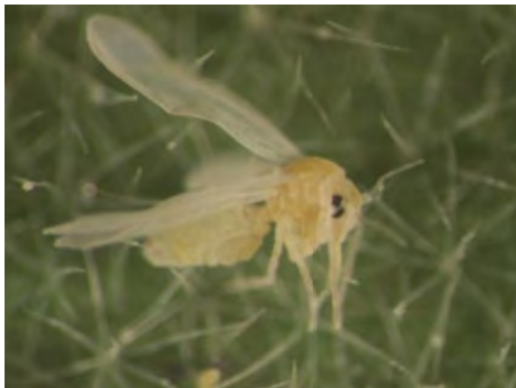
Slika 2. T. vaporariorum – hranjenje.