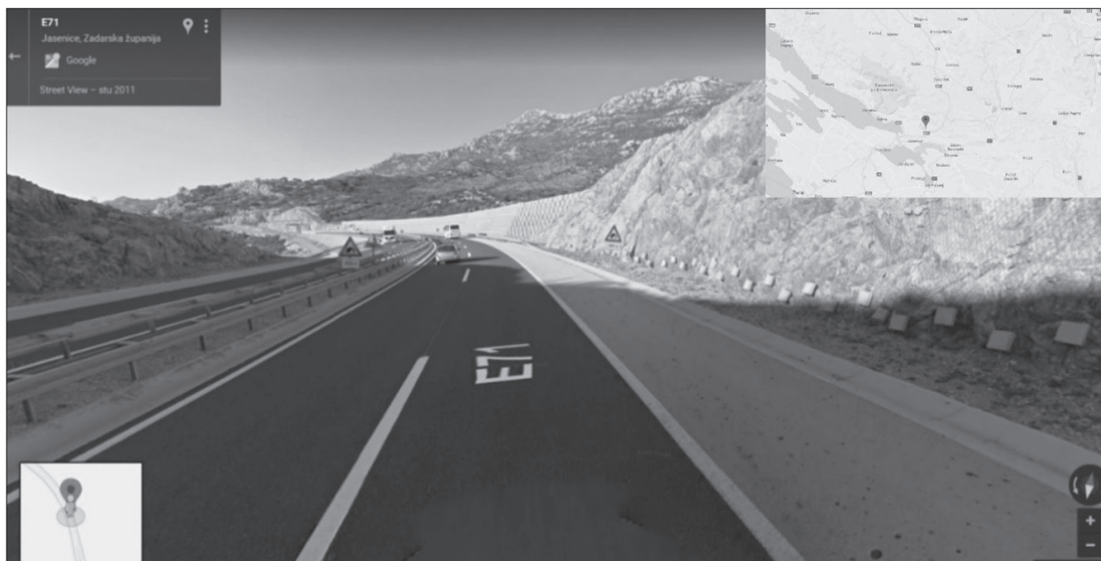
Slika 8. Lokacija PN 1462 na AC A1

Figure 8. Location of the 1462 accident on A1 motorway