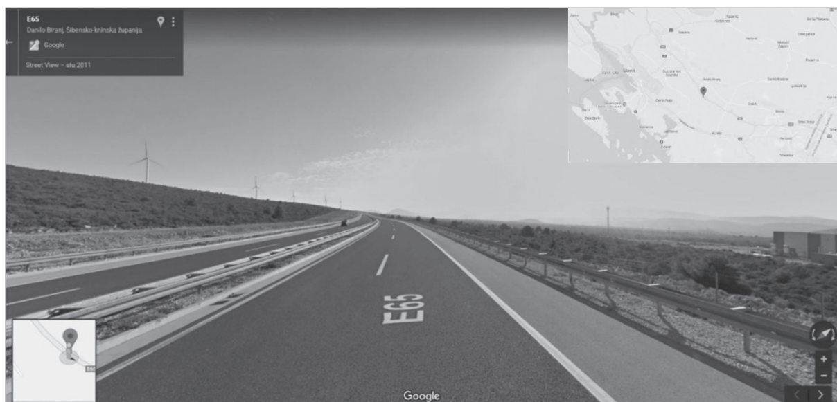
Slika 7. Lokacija PN 17082 na AC A1

Figure 7. Location of the 17082 accident on A1 motorway