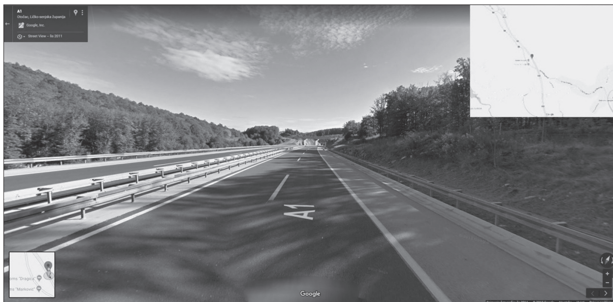
Slika 4. Lokacija PN 22316 na AC A1

Figure 4. Location of the 22316 accident on A1 motorway