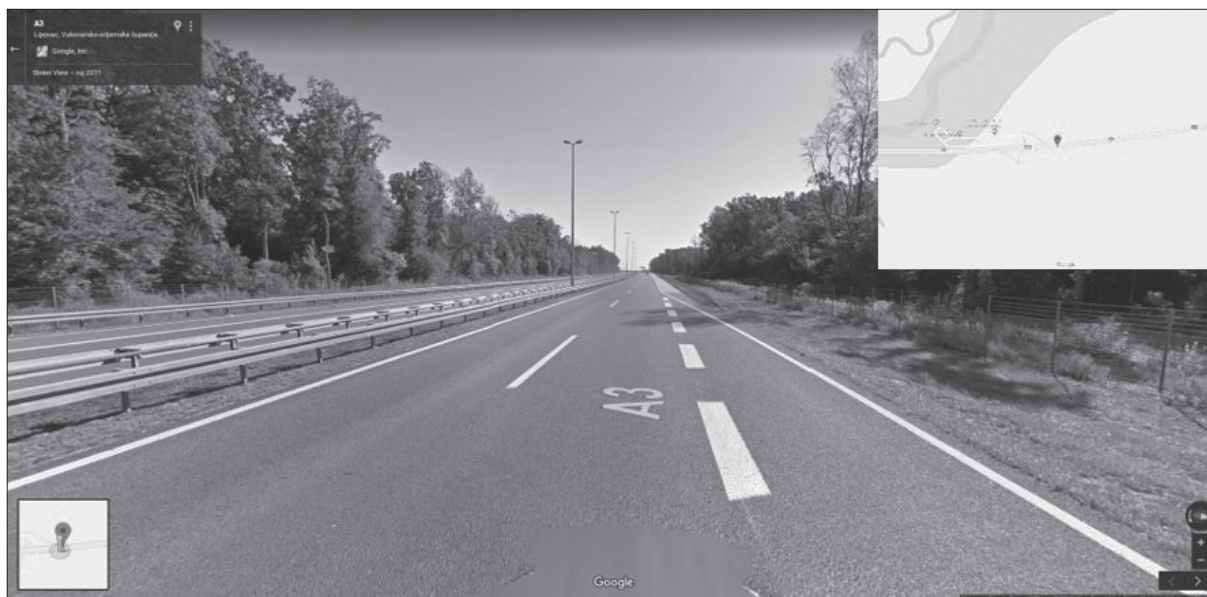
Slika 5. Lokacija PN 12568 na AC A3

Figure 5. Location of the 12568 accident on A3 motorway