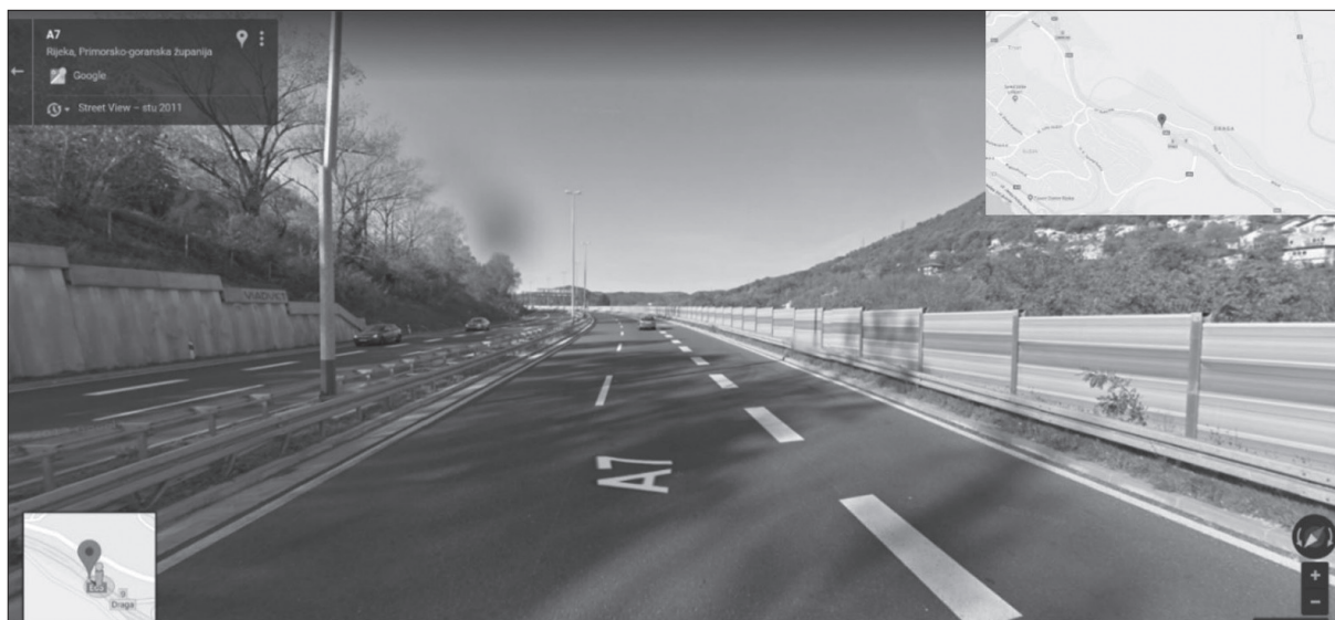
Slika 6. Lokacija PN 34870 na AC A7