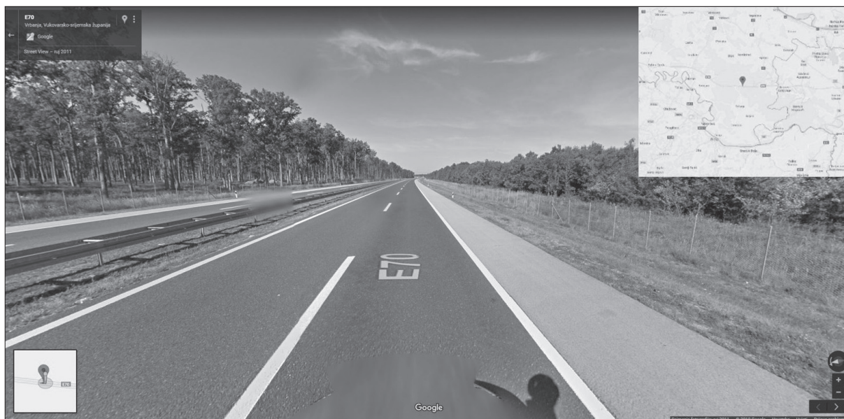
Slika 3. Lokacija PN 19434 na AC A3

Figure 3. Location of the 19434 accident on A3 motorway