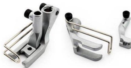
Slika 8. Dvostruka pritisna nožica s izdvojenim dijelovima tvrtke Dürkopp Adler [20]

Kod šivanja kožnih automobilskih sjedala najčešće se upotrebljava dvostruka pritisna nožica. Sastoji se od vanjske pritisne nožice koja služi pridržavanju materijala i unutarnje pritisne nožice koja pomaže u transportu materijala, Slika 8.