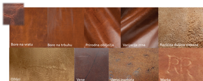
Slika 3. Tragovi – prirodna obilježja na koži životinja [5]

Na izgled i kvalitetu prirodne kože utječu životni uvjeti u kojima je životinja uzgojena. Tragove na koži ostavljaju ubodi insekata, rane, ožiljci, vene, bore, oznaka brenda itd., Slika 3.[5]