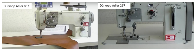
Slika 7. Šivaći strojevi namijenjeni šivanju kožnih automobilskih navlaka tvrtke Dürkopp Adler [19]

moći šivati materijale različitih sirovina i debljina bez oštećenja igle, konca i materijala. Primjer šivaćih strojeva za šivanje kožnih automobilskih navlaka tvrtke Dürkopp Adler, Slika 7. Njihova optimalna brzina šivanja jest oko 2800 min -1 . Mogu biti izrađeni s produženom glavom i slobodnom rukom kako bi se olakšalo rukovanje materijalom veće površine tijekom šivanja.