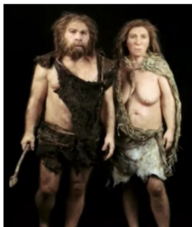
Slika 2. Neandertalac, Hušnjakovo brdo kod Krapine [3]

Prerada životinjske kože pripada najstarijim ljudskim djelatnostima. To potvrđuju bilješke na babilonskim glinenim pločicama iz 1250. godine prije Krista. Čovjek je kožu upotrebljavao od svojeg postanka kako bi se zaštitio od vanjskih utjecaja, napada ljudi i životinja, Slika 2. [3, 4].