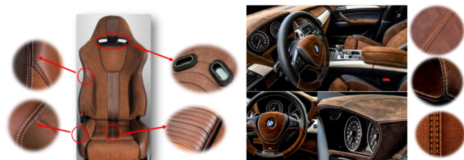
Slika 6. Kožno automobilsko sjedalo i interijer luksuznog automobila marke BMW obložen prirodnom kožom [15 – 18]

Igljeni konci prema standardu označavaju se brojevima 1, 2, 3 itd., dok se donji konci označavaju malim slovima a, b, c itd. [14]. Tipovi šivanih šavova normirani su prema ISO 4916 [11]. Vrsta šivanog šava sastoji se od pet znamenki. Prva znamenka – skupina šivanog šava (1 – 8), druga i treća znamenka – raspored slojeva materijala za šivanje (01 – 99), četvrta i peta znamenka – položaj uboda ili probijanja igle (01 – 99) [14]. Na Slici 6. prikazana je kožna automobilska navlaka i interijer luksuznog automobila marke BMW obložen prirodnom kožom. Istaknuti su karakteristični tipovi šavova [15 – 18].