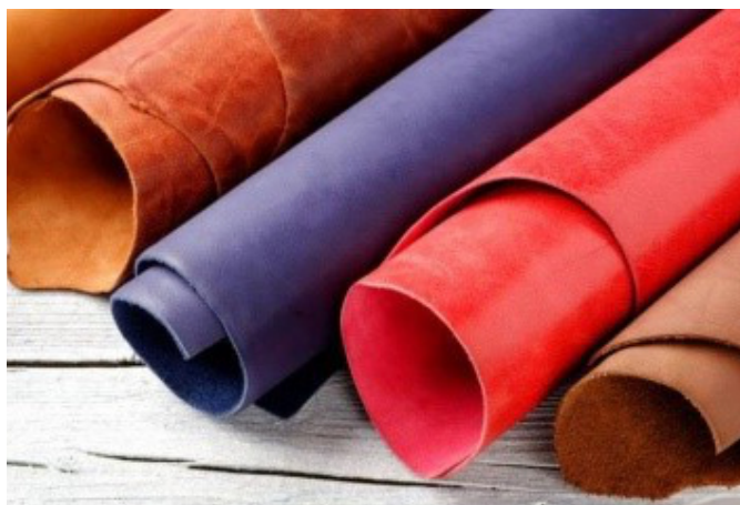
Slika 1. Prirodna koža [1]

Materijali koji se upotrebljavaju za automobilske navlake u prometlima izrađeni su od različitih materijala raznim tehnološkim procesima. Prirodna koža jedan je od najskupljih, ali i najpoželjnijih materijala koji se upotrebljava za automobilske navlake i interijer automobila. Svojim iznimno lijepim i luksuznim izgledom privlači kupca te pridonosi