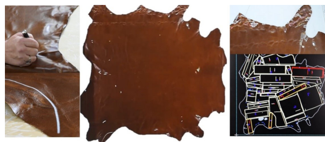
Slika 4. Obilježavanje pogrešaka na koži i prikaz krojne slike [8]

Nedostaci, odnosno problemi koji postoje u primjeni prirodne kože odnose se na veličinu kože i životni vijek životinje, prirodna obilježja koja je životinja za života dobila na koži, Slika 3. Prirodna koža različite je veličine i nepravilnog oblika. Prije krojenja provodi se kontrola kvalitete kože te obilježavanje pogrešaka, Slika 4.